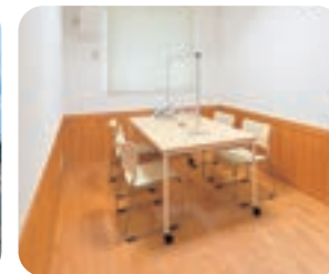
保健センターの相談室