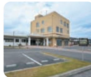
野田村保健センター

子育て支援センターでは月ごとにイベントがあったり、離乳食教室や育児講座などを開催しています。村のあちこちに遊具や公園があり親子連れが集まっているので、たくさん遊んでお友達を作ってみてくださいね。