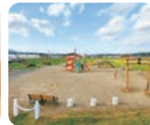
村内には公園がたくさん