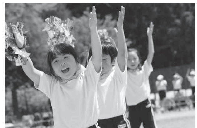
パプリカ～野田村の未来に種をまこう～