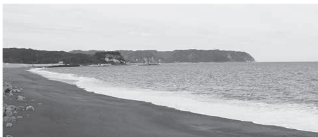
村のジオサイトの一つである十府ヶ浦海岸（十府ヶ浦海岸については次回以降で紹介いたします）

平成25年には巨大地震・津波の襲来を何度も受けた先人の営みや、東日本大震災の経験を後世に伝えるため、ジオパーク認定を受けています。私たちの生活や歴史にとっても深い関わりのあるジオパークについて、これから数回に分けてご紹介します。