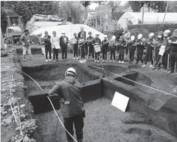
昔の暮らしに興味深々！

5月7日、野田小学校の6年生が同校裏にある古館山遺跡発掘調査の現地見学をしました。児童は、竪穴住居跡やかまど・煙突の跡など、普段見ることのない現場に少し緊張しながらも、村担当者の説明にメモを取りながら熱心に耳を傾けました。