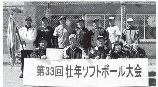
優勝した城内上チーム