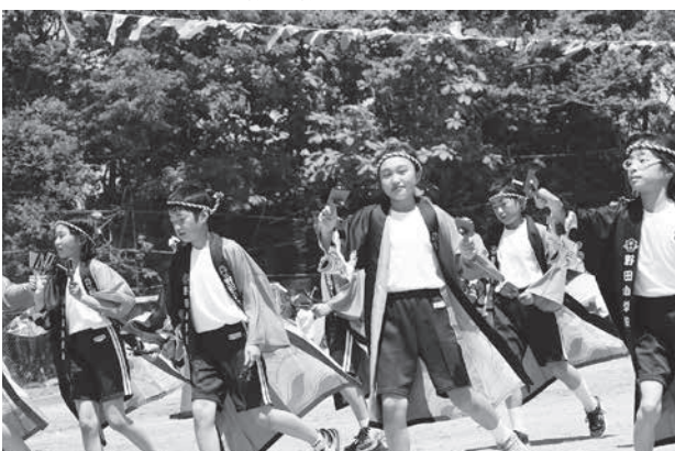
野田小ソーラン2019 ～日進月歩～