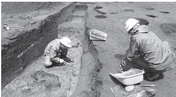
埋蔵文化財の発掘調査の様子