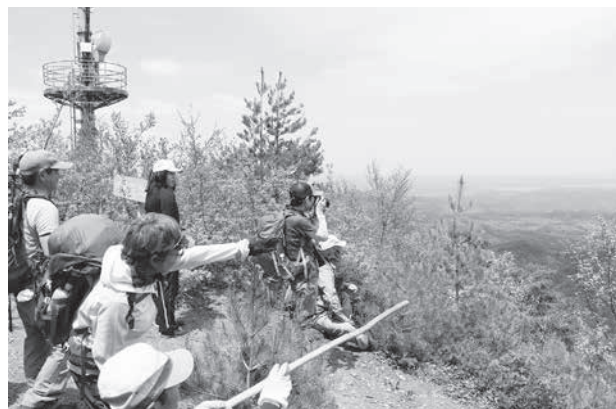
山頂からの絶景にくぎ付け！

村の最高点である男和佐羅比山の山頂まで、急な坂道を息をあげてたどり着くと、村中心部や海まではっきりと見渡せる景色が広がり、その絶景を目にした参加者からは歓声が上がりました。