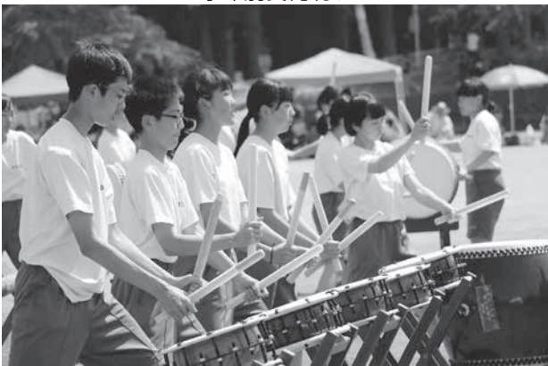
野田中創作太鼓「野田中囃子」