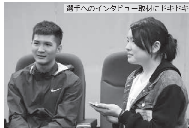
選手へのインタビュー取材にドキドキ