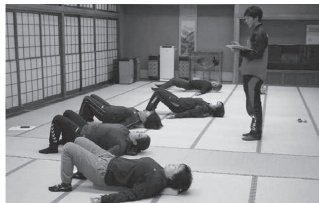
ストレッチ効果は抜群！

1月25日・2月8日、総合センターで「ストレッチポール教室」が行われ、12人が参加しました。ストレッチポールは、筒状のポールの上に横になって行うストレッチで、一流スポーツ選手から高齢者施設などで幅広く取り入れられています。初めて参加した人は、体の変化に驚いた様子で、驚きの声が多く上がっていました。