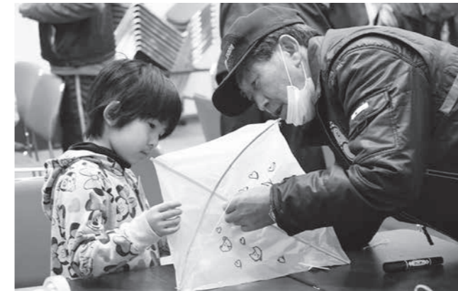
「骨組みをしっかり作れば高く揚がるよ」

1月5日、村生涯学習センターで「のだキッズセンター冬休みスペシャル」が行われました。色とりどりのマーカーを使って、ビニールにのんちゃんなど可愛いイラストを描く子供たち。高く揚げるコツを知っているおじいちゃんたちから手ほどきを受けながら骨と糸をつけてもらいます。一緒に作り上げたたこは、電線よりも高く揚がっていました。