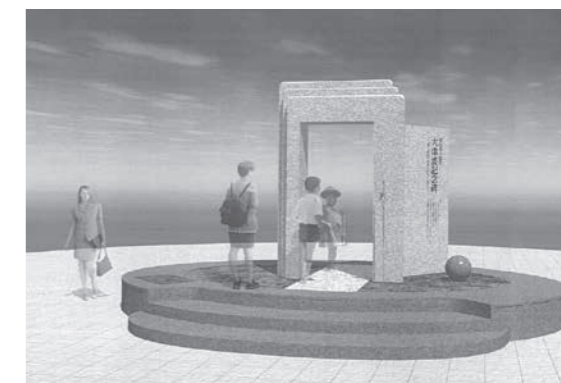
津波に対する防災思想の伝承を目的とする津波記念碑(イメージ)

記念碑の建立に対しまして、ご支援・ご協力くださいました皆さまに、心から感謝申し上げます。