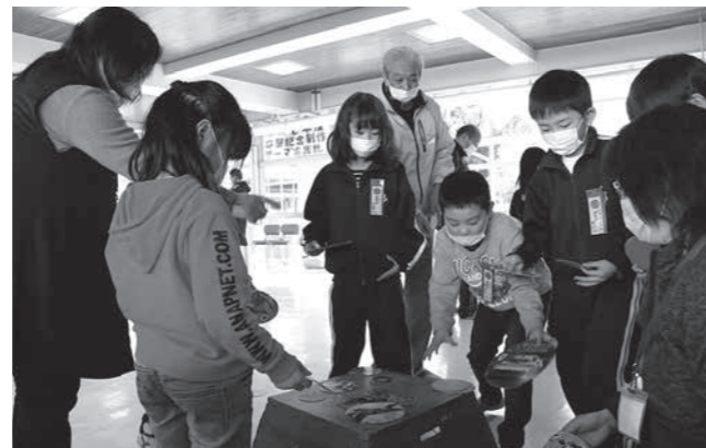
めんこ遊びを楽しむ児童

昔遊びに精通した9人の講師から、めんこやおはじき、けん玉など昔ながらの遊びを教わる児童。教わった先から全力で昔遊びを楽しむ児童の姿に、地域の人も元気をもらっているようでした。