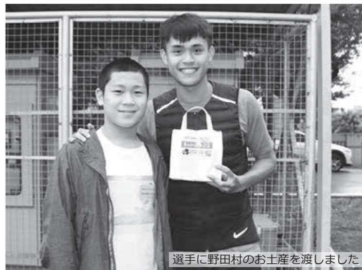
選手に野田村のお土産を渡しました