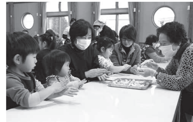
「上手にまん丸お団子を作れるかな?」

園児らによるダンスやミズキ団子作りなどを楽しんだ後、一緒に美味しい給食を味わう参加者たち。話したいことがたくさんある園児に、「うん、うん」と優しく相づちを打ちながら温かな触れ合いを楽しんでいました。