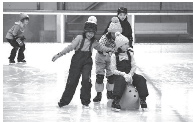
自由滑走も楽しみました

午前中は館内のプラネタリウムを鑑賞し、午後からスケートの指導を受けました。初心者の子も目に見えるほど上達し、最後には全員が上手に氷上を滑り、約2時間ウィンタースポーツを楽しみました。