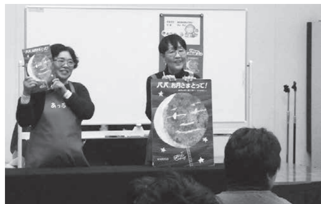
大型絵本の読み聞かせ

大型絵本の読み聞かせや、趣向を凝らした遊びなどが盛りだくさんな同イベント。当日は、子ども達の楽しそうな声が会場内に響いていました。