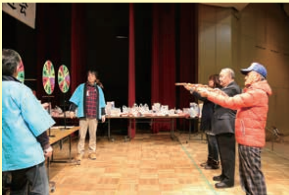
当選番号を決めるルーレットに矢を放つ坂下町長(右側中央)ら

また、来場者に配られたビンゴカードで景品が 当たるビンゴゲームでは、番号が呼ばれるたび会 場全体が一喜一憂するなど、にぎわっていました。