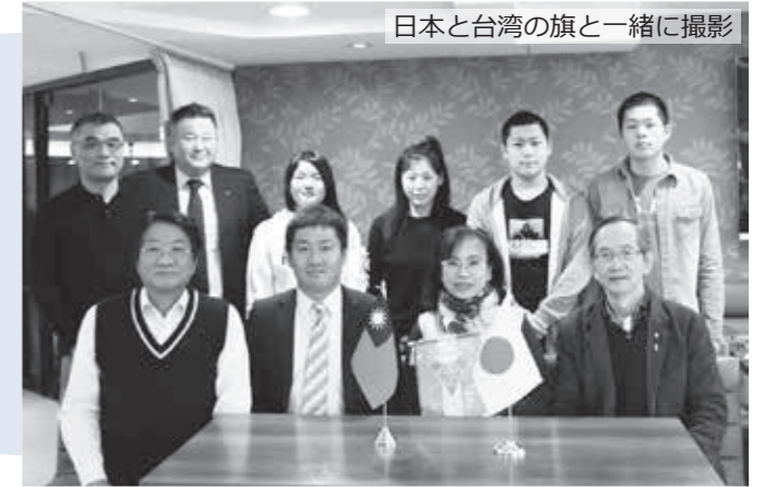
日本と台湾の旗と一緒に撮影

リーククラブ、台北福齡ロータリークラブを訪れ、村を代表して皆さんに感謝の思いを伝えました。 台湾陸上協会、国家トレーニングセンターでは、台湾の陸上選手を相手に1対1で取材。一眼レフカメラを手に、台湾でトップクラスの選手の一挙手一投足を逃さずシャッターを押し続けました。 また、国立故宮博物院、台湾糖業博物館を視察。台湾の歴史と文化について学び、台湾をより身近に感じる一時を過ごしました。