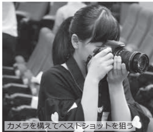
カメラを構えてベストショットを狙う