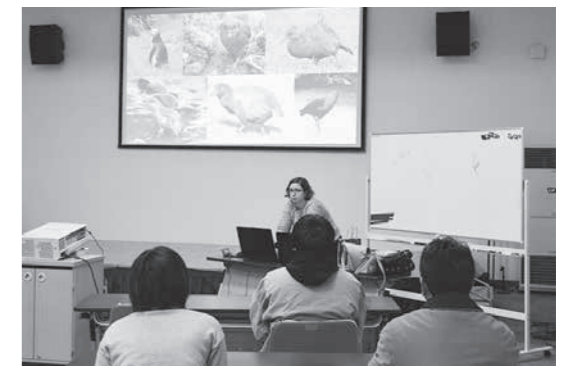
熱心に耳を傾ける参加者

あっぷっぷおはなし会 お気軽にお越しください！ ○日時 3月17日(土) 午後2時～ ○場所 村図書館