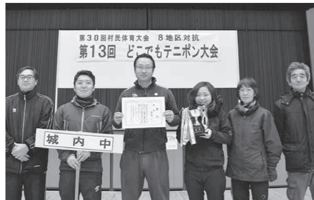
来年未だの4連覇なるか！