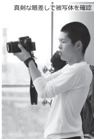
真剣な眼差しで被写体を確認