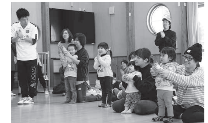
参加者全員の笑顔がまぶしい

1月27日、野田村保育所で実技講座 親子体操が行われ、村内外から多数の親子が参加しました。県内の男性保育士のグループ「チームファンタジスタ」を講師に迎え、流れる音楽に合わせて体を動かす参加者たち。お父さん・お母さんと一緒に嬉しい様子の子どもの笑顔につられて参加者全員が笑顔になる、楽しい一時となりました。