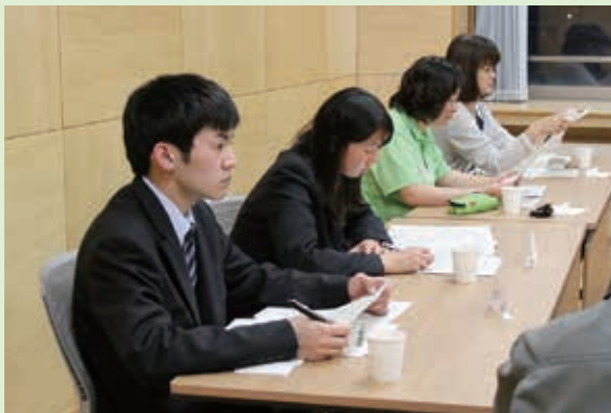
真剣な様子の高校生委員

施設分離型の小中一貫教育を行っている様似小学校と様似中学校において、今年度から地域とともにある学校としてコミュニティ・スクール(CS)がスタートしました。CSの推進にあたり学校運営協議会を立ち上げ、6月25日に第1回協議会を開催。委員の中には、様似の小・中学校を卒業し、現在浦河高校2年生の生徒2名も委嘱されました。様似町では公職に高校生を起用することはこれまでになく、高校生委員は「内容が難しいが、色々な部分で意見を出していきたい」と、緊張しながらも会議に参加していました。