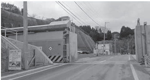
7月31日に運用開始する広内陸閘