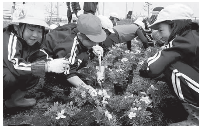
楽しげな様子で花を植える児童

6月15日に村民を、18日には野田小学校児童を対象に十府ヶ浦公園内花壇への花苗の植え付け作業が行われました。植え付けたのは県土木技術振興協会の支援事業により購入したサルビアなど約3千個の花苗。小中学生が管理する野田のもりゾーンでは、児童の手によって「スマイル」の字が形どられた、見る人たちを元気づける花壇が作られました。