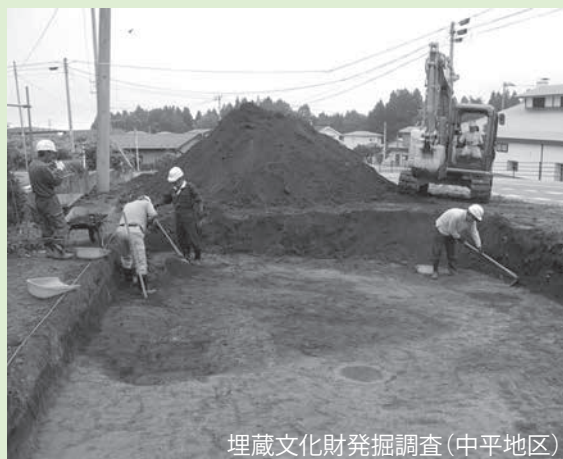
埋蔵文化財発掘調査(中平地区)

届出が遅くなると工事に支障が出る場合がありますので、住宅などの建築を計画している場合は、お早めに村教育委員会事務局 ☎ 78・2936にお問い合わせください。