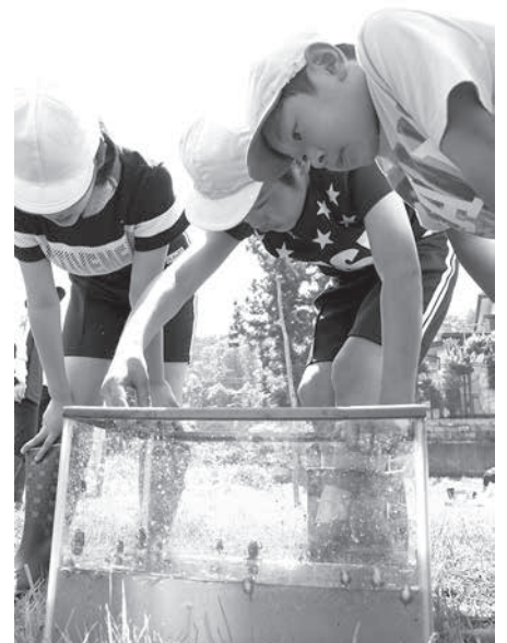
捕まえた生き物を観察する児童

カエルのほか、アメンボなどを発見しては手に取り、改めてどのような生態をしているのかじっくりと観察していました。