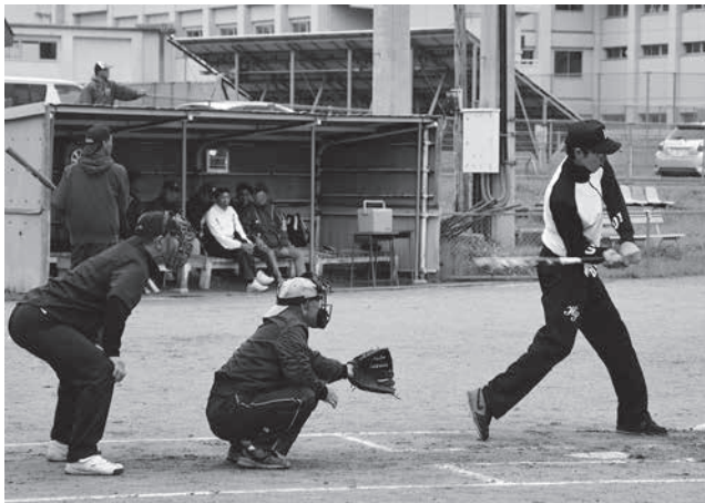
打って走って投げて、全員が活躍しました