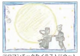
②ロマンチックなイラストにウツリ(*´艸`)セタっていいね^^