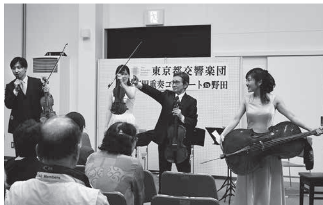
弦楽器の仕組みを丁寧に説明してくれました

6月29日、生涯学習センターで東京都交響楽団による弦楽四重奏コンサートが開催され、約80人が鑑賞しました。演奏楽曲は、クラシックのほか「舟唄」など11曲。アンコールでは「荒海団のテーマ」も披露され、最後まで観客を楽しませてくれました。途中には楽器紹介コーナーもあり、楽器やクラシックを身近に感じる絶好の機会となりました。