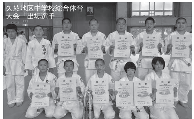
久慈地区中学校総合体育大会 出場選手