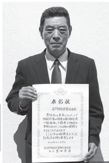
石門納税貯蓄組合