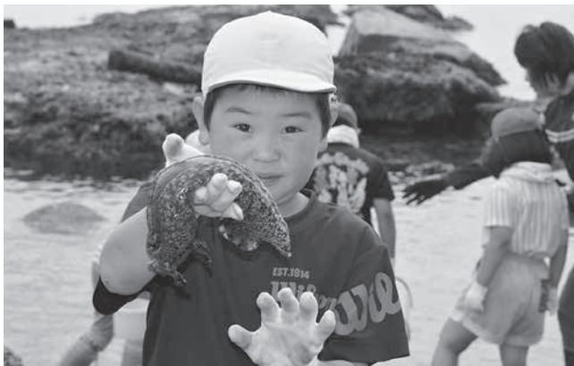
「アメフラシを見つけたよ！」

児童は岩の隙間に手を伸ばし、カニやヒトデなどの生き物を発見すると大きな歓声をあげて、友達と見せ合っていました。