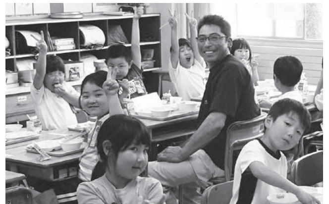
荒海ホタテを使った給食は絶品！

6月25日、野田小学校で荒海ホタテ給食が初開催され、同校5年生32人が荒海ホタテなどについて理解を深めました。荒海団団員から荒海ホタテの人気に関わる5つのポイントについて説明を受けた児童たち。ホタテの生態と荒海団(漁師)の仕事について知りたいことは尽きないようで、質問タイムでは次々と質問を投げかけていました。