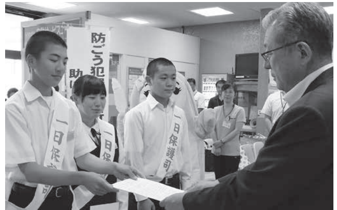
小田村長にメッセージを伝達する一日保護司の生徒

7月4日、社会を明るくする運動の一環として、野田中学校生徒会執行部の代表者3人に委嘱状が交付され、生徒は一日保護司として村役場ホールで小田村長に総理大臣メッセージの伝達を行いました。堂々とした態度でメッセージを伝達した生徒は、保護司らとの意見交換を通じて、保護司の役割と活動内容について理解を深めました。