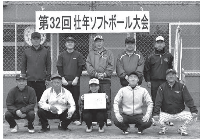
14年ぶり優勝の城内中チーム