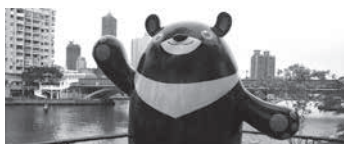
高雄熊 (高雄市マスコット キャラクター)