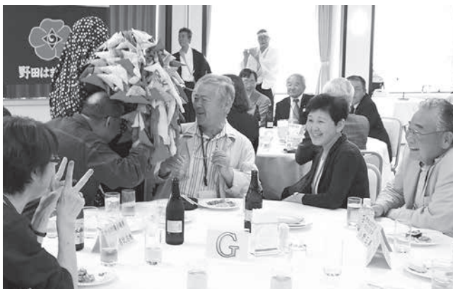
神楽もお祝いに駆けつけました

関東地方在住の村出身者で構成される野田はまなす会が今年で設立30周年を迎え、6月17日に都内の東海大学校友会館で総会・記念祝賀会が開催されました。会場には、ゲストとしてなもみや大黒舞などの村伝統芸能が登場。村を飛び出して披露されたアトラクションに会場は大いに盛り上がり、30年の歴史を満面の笑みで祝っていました。