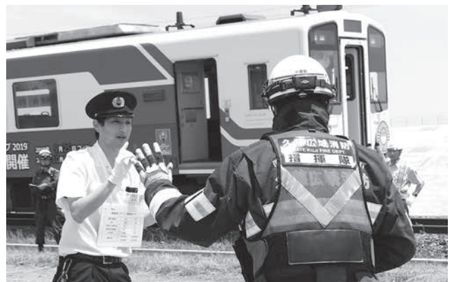
適切な状況報告が求められます

6月19日、三陸鉄道野田玉川駅から陸中野田駅の区間で同社による異常時運転取扱訓練会が行われました。同訓練は、列車の安全・安定輸送の確保を目的に毎年実施するもので、今年は列車内でのテロを想定に実施。社員らは乗客への避難誘導や、警察・消防への通報訓練を通じて、緊急時に乗員乗客らの安全を確保するための動きを再確認しました。