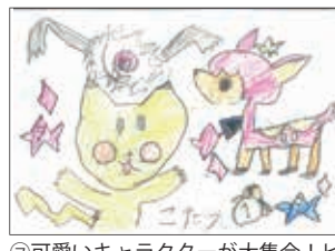
①可愛いキャラクターが大集合!ピカチュウの口元がとっても可愛い♡