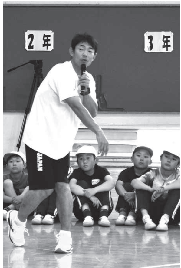
プロの動作を間近で観察