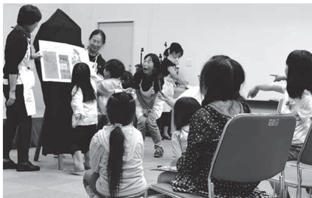
大人にも子どもにも、絵本は楽しいもの

6月9日、村生涯学習センターで出張絵本サロン(3.11絵本プロジェクトいわて主催)が開催され、親子ら約40人が来場しました。読み聞かせのほか、歌や手遊びなど聞き手参加型の仕掛けが来場者の心を掴み、終始楽しそうな声に包まれる会場。最後には1人2冊の絵本がプレゼントされ、来場者はどの本にしようかと悩みつつ、嬉しそうに持ち帰っていました。