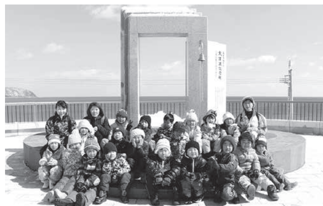
伝承、追悼、未来などを表す記念碑の前に並ぶ園児たち

3月6日、大津波記念碑の園児参加イベントが行われ、村内の5歳児19人が参加しました。記念碑に込められた思いや意味について説明を受けた後、春から通う小学校や自分の顔などを描いた小石を丁寧に埋め込む園児たち。園児らは今回の体験を心に刻み、記念碑とともに将来にわたって津波の教訓を語り継ぐ担い手として年を重ねていきます。