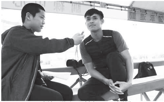
台湾の選手に取材する野田中学生