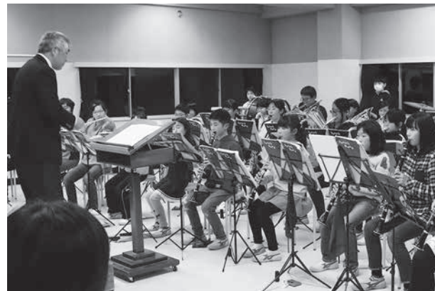
野田吹奏楽団との共演により、さらに圧巻の演奏に！

第1部は「歩み」、第2部は「ありがとう♡」をテーマに、定番の曲から流行曲まで幅広い楽曲を演奏。のだ吹奏楽団との合同演奏もあり、エールや感謝など1年間のさまざまな想いが込められた美しい演奏に、観客たちは耳を澄ませて聞き惚れていました。