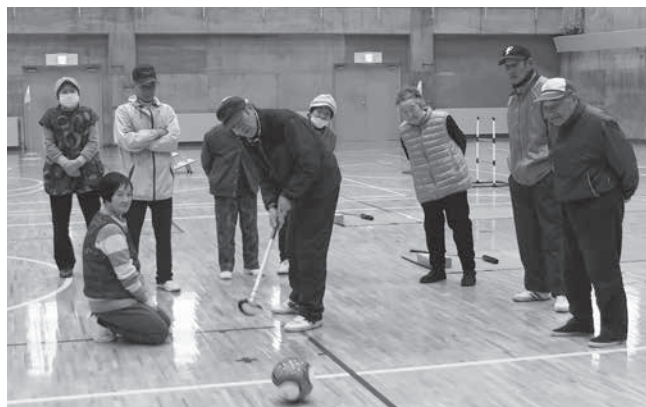
仲間に見守られ、集中の一打