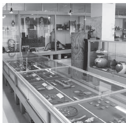
村の歴史を伝える貴重な郷土資料

村芸術文化協会と連携を密にしながら活動団体の育成・支援を図り、多くの村民が芸術文化