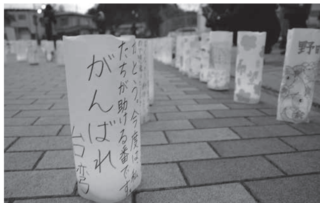
灯りに照らされた台湾へのメッセージ

キャンドルは株式会社トモスから寄贈いただいたもの。今年は、震災復興の想いととも、台湾地震被災者への応援の想いを込めて村内の児童・生徒が書いたメッセージとイラストを温かい灯りで照らし出していました。