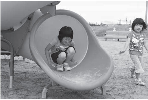
十府ヶ浦公園で遊ぶ子どもたち

ンコイン制、スクールバスの混乗を継続するとともに、更なる村民の利便性の向上を図るため、村営バス2台体制による運行を導入したところであり、今後も検証を加え、運行の充実を図ります。