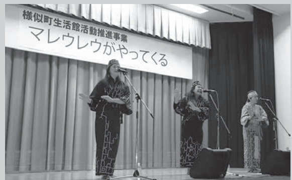
すてきな歌と楽しいトークで盛り上がるライブ