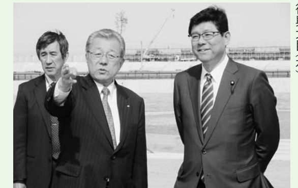
小田村長(中央)から土地区画整理事業の状況の説明を受ける高木復興大臣(右)