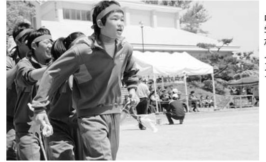
中学校ムカデリレー

5月14日に野田小学校で運動会が、21日に野田中学校で体育祭がそれぞれ行われ、児童・生徒は『村民に元気を』を心に、優勝を目指して熱い戦いを繰り広げました。