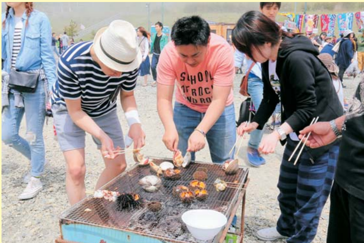
買ったばかりのウニやホッキ貝の海鮮バーベキューを 味わう観光客

会場のバーベキューコーナーでは、買ったばかりのウニやホッキ 貝などの海産物を、その場で焼いて食べる観光客で大盛況でした。