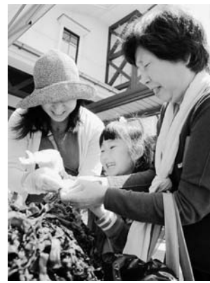
ワカメの詰め放題も大人気！（ぱあぶる春まつり）

5月3日と4日に観光物産館ぱあぶる前で「ぱあぶる春まつり」が、5月15日に愛宕参道広場で「ベアレンビアフェスタ in 野田村」がそれぞれ行われ、多くの人で賑わいました。