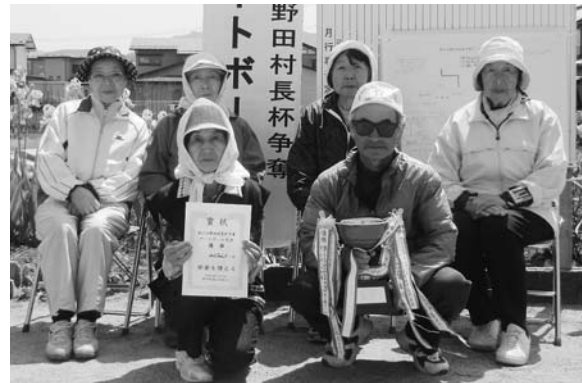
初出場・初優勝を果たしたのんちゃんチーム

のんちゃんチームが初優勝!!! 〜村長杯ゲートボール大会〜 5月29日(日)、いととコロ広場で第27回野田村長杯争奪ゲートボール大会が開催され、村内各地区から9チーム、約60人が参加しました。 試合は、参加者全員が真剣にプレーをしながらも終始和やかな雰囲気で行われました。 成績は初出場の「のんちゃんチーム（門前小路）」が優勝を果たし、準優勝は「前田小路Bチーム」、3位は「中平チーム」となりました。