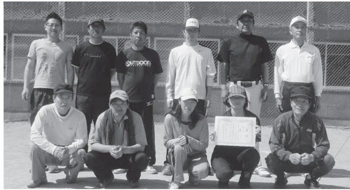
優勝した玉川チーム

1位は玉川チーム 〜30年ソフトボール大会〜 今年度の村民体育大会の幕開けとなる5月22日、第30回30年ソフトボール大会が山村広場で開催され、村内各地区の8チーム、約130人が参加しました。 暑さに負けない熱戦が繰り広げられ、優勝を飾ったのは「玉川チーム（優勝4回目）」。準優勝は「米田・南浜チーム」、3位は「新山チーム」でした。