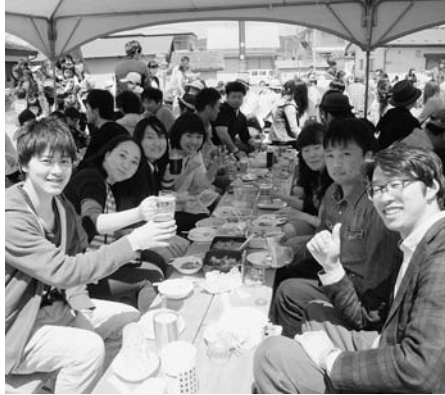
みんなで楽しくカンパシイ！（ベアレンビアフェスタ）

参加者は村の食材を使った料理や飲み物に舌鼓を打ち、楽しいひとときを過ごしました。