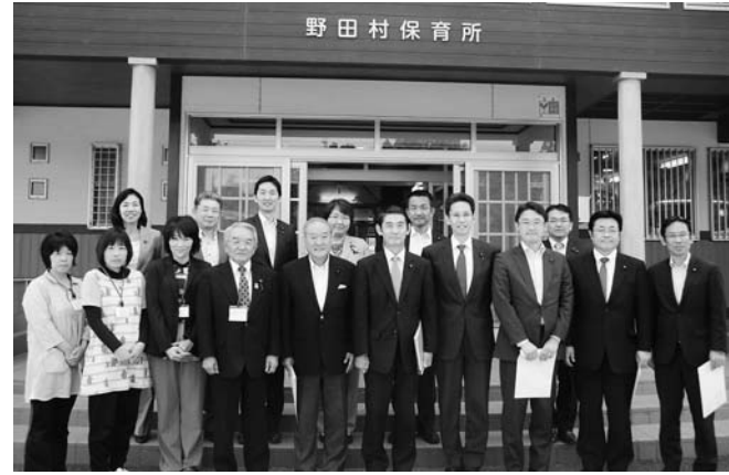
野田村保育会職員らと保育所前で記念撮影

5月23日、衆議院東日本大震災復興特別委員会の委員13人が城内地区土地区画整理事業地や元野田村保育所敷地、野田村保育所を訪れ、震災からの復旧・復興状況や当時の状況などについて視察しました。園児ら全員が避難した野田村保育所では、避難方法や避難訓練などについて職員らが説明。当時を体験した生の声に委員は熱心に耳を傾けていました。