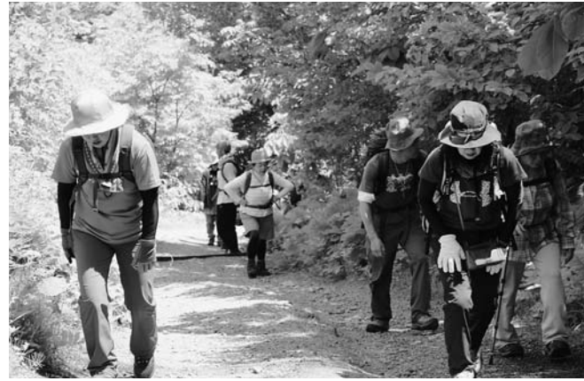
傾斜では「疲れた」「つらい」の声が続出!

5月22日、塩の道を歩こう会が開かれました。当日は村内外から32人が参加。ガイドの説明で塩の道の歴史に触れながら約10km先のゴールを目指しました。急な傾斜が続くアジアの広場からスタートした参加者は息を切らしながらも道中の景色を楽しみながら歩ききり、ゴールでは「お疲れさま」と互いに労わり合っていました。