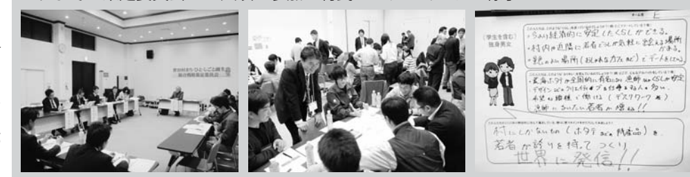
これまでの策定委員会・50人以上参加の村民ワークショップの様子

今後、村内部での調整、住民からの意見公募(パブリックコメント)などの手続きを経て公表し、平成28年度以降の野田村総合計画にも反映していきます。