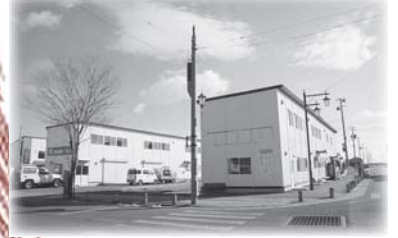
▼国道には「十府ヶ浦」と書かれた看板が設置されています。