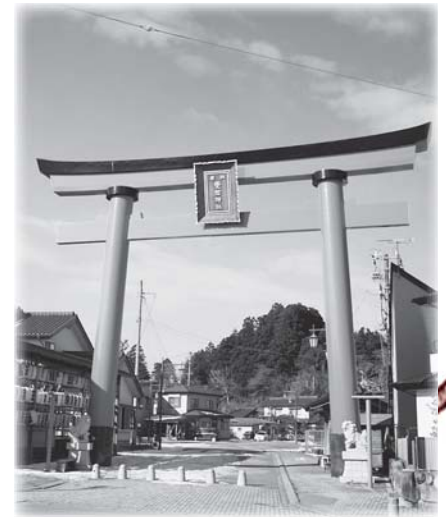
大鳥居をくぐり参道へ…。道なりに進み、海蔵院前まで行ったら、橋を渡り大きな通りへ進みます。