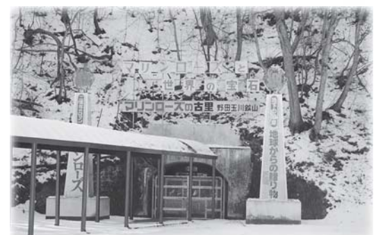
観光坑道として公開しているマリンローズ野田玉川は11月～4月中旬まで休館です。今年、敷地内にワイナリーが建設予定です。