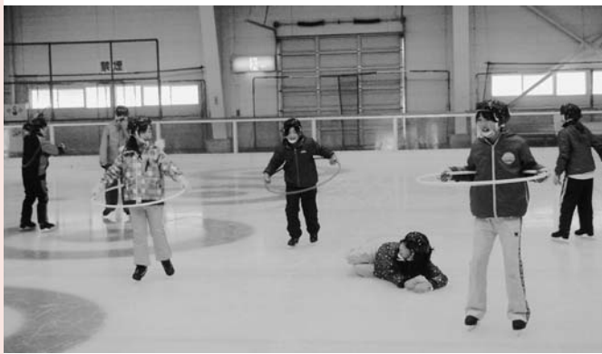
あ、転んじゃった！立ちあがって再挑戦！

1月5日、二戸市県北青少年の家で「スケート教室」を開催し、小学生12人、一般2人が参加しました。初めてスケートに挑戦する児童もいましたが、講師の先生から立ち方や足の動かし方など、基礎的な指導を受け、終盤には全員が自由に滑れるようになりました。