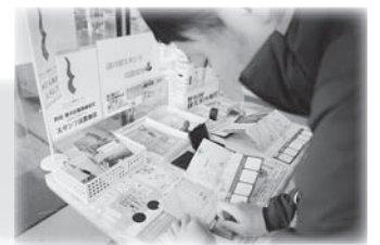
観光物産館ばあぶる店内にスタンプコーナーがあります。

昨年8月に開通したみちのく潮風トレイル野田ー普代コース。今月号では、野田コースを紹介いたします。12月からは踏破認定制度もスタートしており、踏破すると認定証や記念バッジがもらえます。トレイルコースのガイドマップなどは役場産業振興課窓口やスタンプ設置店に置いてありますので、挑戦してみたいはいかがでしょうか。