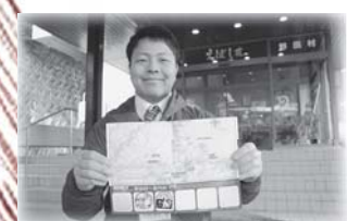
野田ルートスタンプは3つ！今回のルートでは、えぼし荘で全てのスタンプが揃いました！

①道の駅「のだ」観光物産館 ばあぶる 観光物産館ばあぶるはスタンプ設置店。ここでは牛方に入ります。ただ今、39(サンキ)開催中で温かい甘酒もいただけます。(フェアは3月9日まで)