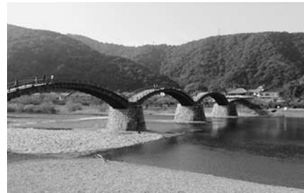
素敵な錦帯橋(きんたいきょう)♪

ニュージーランド人の友だちに会うために、12月に山口県に行きました。長い時間かかりましたが、新幹線の窓から広島や大阪を見ることができ楽しかったです。山口県にいる間に、岩国市に行きました。岩国市には有名な錦帯橋があります。錦帯橋はとてもきれいだと思いました。山口県はたくさん素敵な景色がありますので、皆さんもぜひ行ってみてください！