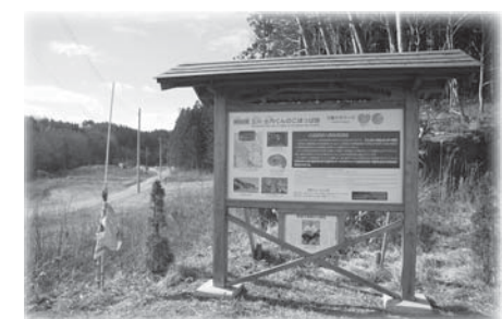
国道沿いに建てられた久慈層群、琥珀採掘場についての案内板。くんのこほっばとは久慈地方の方言で「琥珀掘場」のことだそうです。