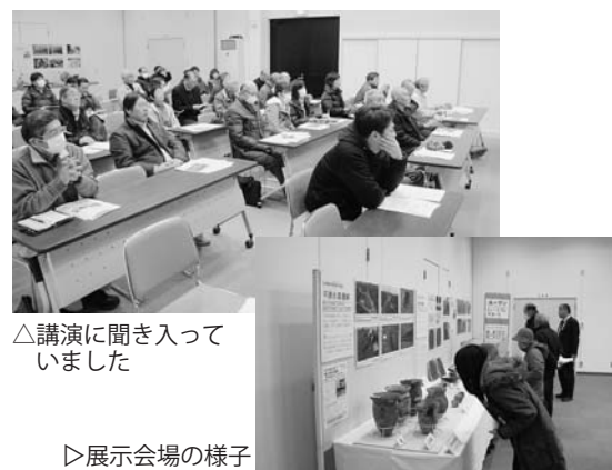
△講演に聞き入っていました

来場者は、鏡像が伝える歴史的文化を学び、さらに歴史に興味を沸かされた様子でした。鏡像は、28日まで県立博物館の特別展で展示されています。