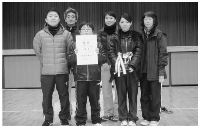
優勝した城内中チーム