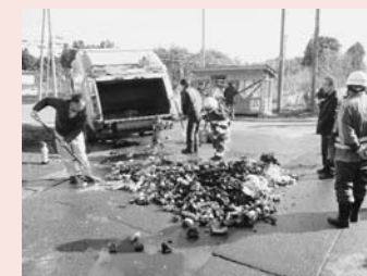
火災が発生した収集車