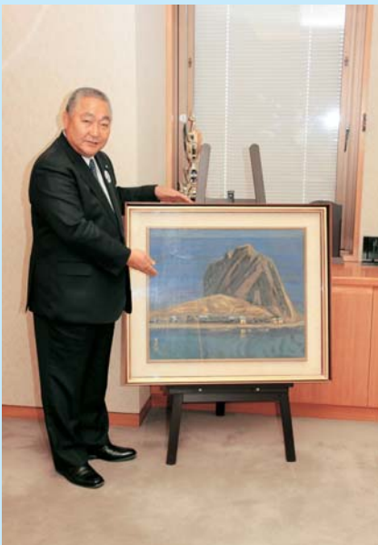
昭和30年代のエンルム岬を描いた「様似岬」

今回の寄贈は、昨年9月に鳥取県で行われたアジア太平洋ジオパークネットワーク山陰海岸シンポジウムに