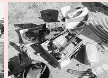
燃えたスプレー缶など