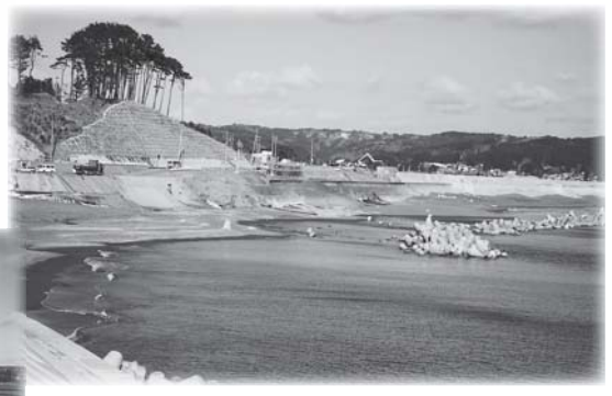
美しく緩やかな弧を描く十府ヶ浦。現在、工事が行われているため砂浜には降りられません。