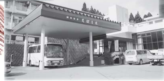
スタンプ設置店であるえぼし荘では、えぼし岩のスタンプをポン！