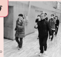
体育館でウォーキング