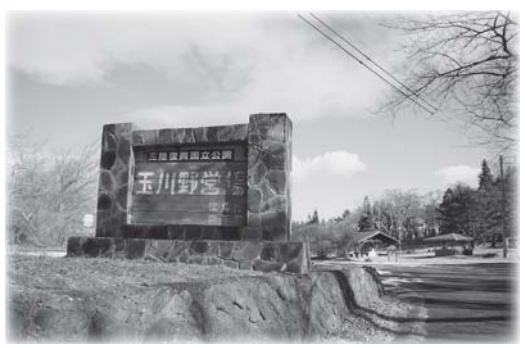
玉川野営場は玉川海岸沿いのキャンプ場で水洗トイレや屋根のあるベンチなども整備されているので休憩にぴったりです。