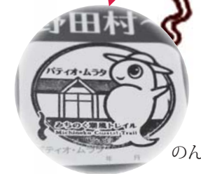
のんちゃんのスタンプ！