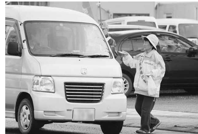
啓発ティッシュを手渡し呼び掛ける交通安全母の会会員

村の死亡事故ゼロは2,400日を超えており、村交通安全母の会や交通安全協会、小・中学校ら関係者は交通安全の徹底、死亡事故ゼロ日数の更新をドライバーらに呼びかけました。