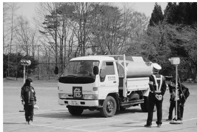
トラックからの目線も確認…子どもの姿が見えにくいなあ

安全な歩行の仕方、自転車の利用の仕方についての理解を深め、事故防止を心がける態度を養うことを目的とした交通安全教室が、4月22日、野田小学校の全学年の児童を対象とし同校校庭で開催されました。児童らは山根野田駐在所長や交通指導員、交通安全母の会の皆さんから安全な歩き方、自転車の乗り方などについて実技などを通して学び、事故防止への意識を高めました。