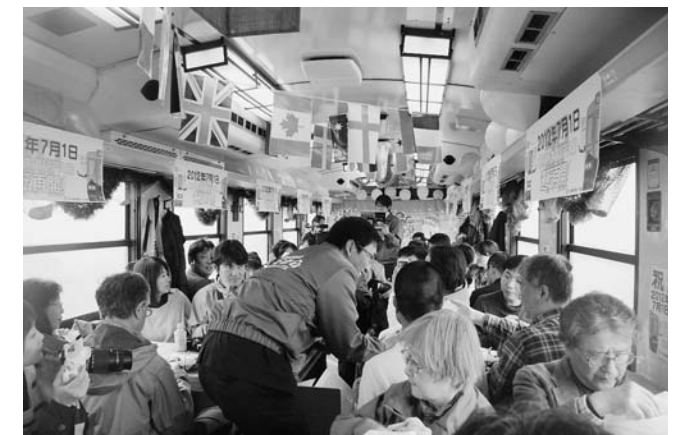
車内は窓が曇るほどの熱気でした

昨年4月6日に、全線運行再開を果たしてから約1年が経ち、4月4日～5日の2日間、久慈一宮古間で北リアス線の全線開業1周年記念イベントが開催されました。村では、4月5日、イベント列車の歓迎と乗客への特産品おふるまいを実施し、陸中野田駅～野田玉川駅間の車内では、株式会社のだむらの職員によるのだ塩を主とした特産品PRを行いました。