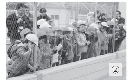
写真①お友達と仲良くピース。稚魚とっても可愛かったね。 ②漁協の施設を見学。魚がいっぱいでびっくり。