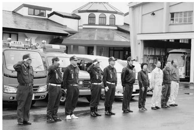
順路を確認しパレードに臨む参加者

パレードには、消防団や県、村森林組合、久慈消防署野田分署、久慈警察署野田駐在所などが参加し、火の取り扱いの不注意により大切な緑が失われないよう山火事防止を呼び掛け、村内全域を回りました。