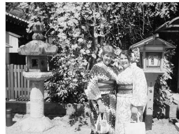
桜に着物姿がよく合います(京都でお母さんと記念写真)

皆さんこんにちは。最近は暖かくなってきましたね。私は春が好きだから、とても嬉しくなります。 春休みに、私のお母さんが日本に来ました。最初は東京に行きました。お母さんは、東京がとてもピカピカして驚いていました。それから京都に行き、金閣寺や清水寺に行ったり、着物を着てみたりしました。桜が満開ですごくきれいでした。京都の後、野田に帰りました。お母さんは私の生活を体験しようと、いろいろな事をやりました。お母さんは、野田を「とても素敵なお所」と言っていました。お母さんに日本での私の生活を紹介できて、とてもハッピーでした。