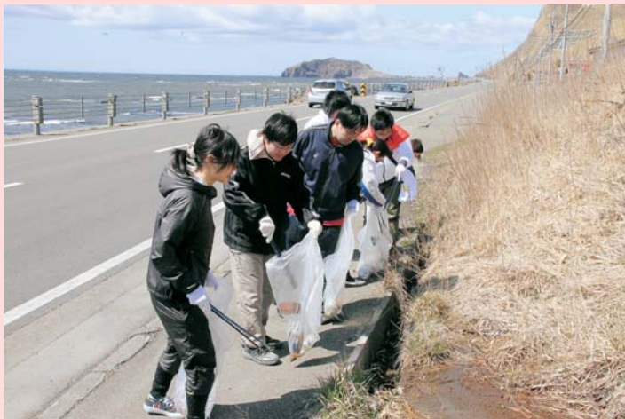
国道沿いのゴミを拾う青年団員

この日に合わせ、多くの自治会でも清掃活動が行われ、その際に出されたゴミも含め約670kgのゴミが回収され、本格的な観光シーズンを目前に、町の景観の美化に努めました。