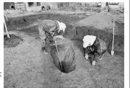
埋蔵文化財はみんなの貴重な財産です！