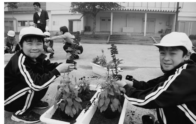
友だちと協力しながら植えました

6月13日、野田小学校で花を育てることを通して、命の大切さや思いやりの心を育てることを目的とした人権の花運動が行われました。