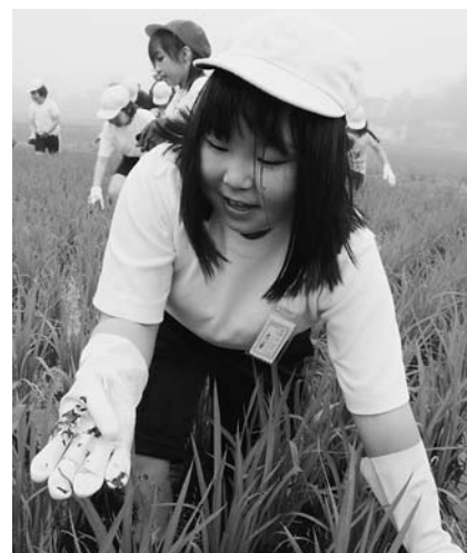
▷アメンボを捕まえたよ!