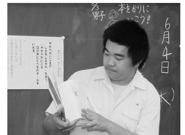
緊張から汗がたたり…心を込めて読みました

読み聞かせの中では、抑揚をつけて子どもたちを物語の世界に引き込むなど高校生の技が光りました。