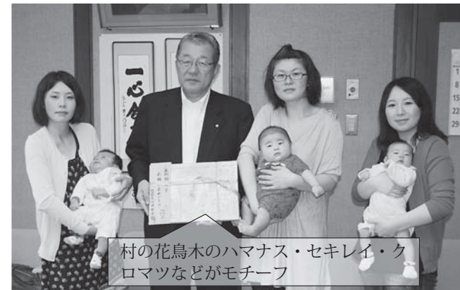
村の花鳥木のハマナス・セキレイ・クロマツなどがモチーフ

祝い品は、野田村の桜の木でできた木製パズルで、だらすこ工房が製作。木との触れ合いを通して五感を養い、やさしくたくましい子どもに育てほしいとの願いが込められています。