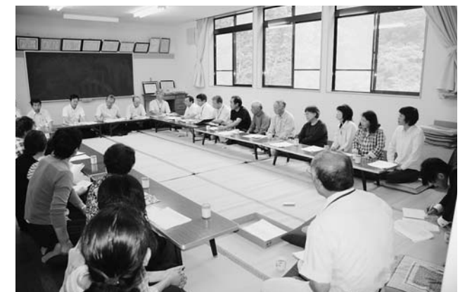
広内地区懇談会の様子

7月1日から始まった臨時福祉給付金や各種復興事業などの説明のほか、各地域の要望や意見をもとに、課題を話し合います。