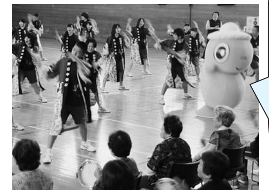
パワーみなぎるソーラン節に感動!

中学校3年生による合唱や創作太鼓、野田中ソーランの披露があったほか、村保健師による介護予防運動