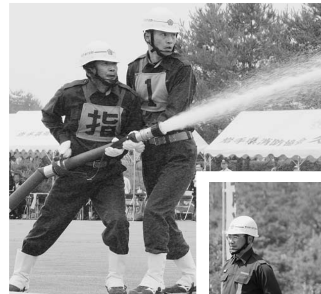
ポンプ車の部、小型ポンプの部ともに9つの分団が出場し、第7分団は6位、第2分団は4位の成績でした。(写真右が第7分団、上が第2分団)