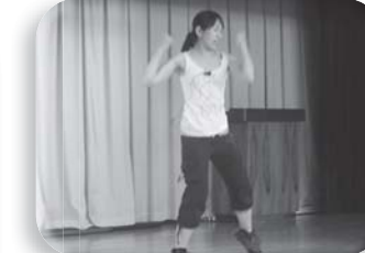
アップ!ダウン!アップ!ダウン! 汗をかいてリフレッシュ!