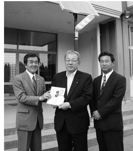
可動式ソーラーLED街灯の前で目録

式には埼玉県から11人が来校。村長と菊地校長に大屋ガバナーから目録が手渡されました。