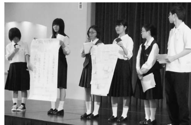
グループごとにまとめた提案を発表

り動けないのではないかと感じます。訓練だと思いつながら動くのでは、緊張感がなく危機感も感じません。突然行われる避難訓練など、もっとリアルなものにすることが、住民や生徒の命を守ることに繋がると思います。さらに、そのような試みが高校生が主体となって実施できると良いのではないかと考えます。 （川）意見交換の中で、宮古の高校生から宮古には「宮古ベース」という誰もが自由に立ち寄り、時間を過ごせる場所があることを聞きました。そこでは高校生が月に一度地域について考える習慣があるということも聞きました。村には、みんなが