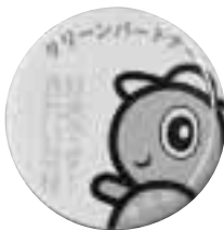
クリーンパートナー 会員バッジ

活動は、通常の生活でごみを拾うことや、不法投棄があったら役場住民福祉課(78-2927)へ通報することです。現在、会員募集中です。