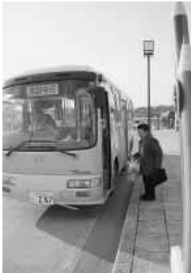
5月から村営バスが全区間一律100円

ヶ浦)を昨年度から復旧工事をしており、早急な整備を国や県に要望、広内地区の県単独治山事業を年度内に実施するよう要望します。