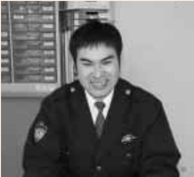
安心した村のため頑張ります

安全で安心な野田村にするため、地域の皆さんと連携をとりながら、精一杯頑張ります。