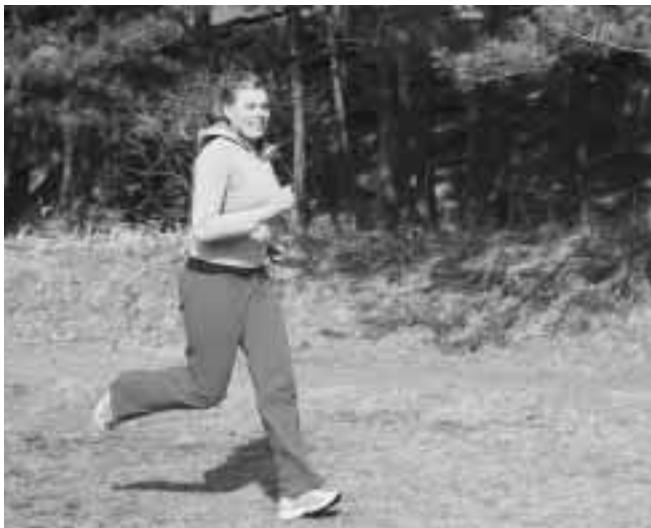
マラソン大会に出場します!!

ようやく、暖かくなり春らしくなってきましたね。先日、初めて日本の卒業式に出席しました。ニュージーランドの卒業式とはだいぶ違うので、とても興味を持ちました。理由は、日本の卒業式はとても厳かで儀礼的だからです。でも、中学校の卒業を祝う会では、生徒や保護者、先生とたくさん話したり笑ったりでとても楽しかったです。中学校の卒業生は、小学校以来初めて、別々の学校に別れて高校に進学することになるので、とても悲しいと思います。日本では3月は「さようなら」を言う季節なんですね。