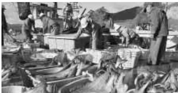
秋さけは豊漁でした

サケ稚魚のふ化放流機能の向上 のため、下安家漁業協同組合が実施する ふ化場の井戸の新設と飼育池の壁面塗装 に対し、支援します。村内外の評価が高まってきているホタテガイの販売力をさらに向上させるため、野田村漁業協同組合が実施する ホタテガイ蓄養施設の増設 に支援し、ホタテ小型貝の流通のため貝毒検査費用への助成をおこないます。また、 ヒラメの放流 や アワビ種苗放流 の経費への助成を継続し、漁家の経営安定向上に支援します。