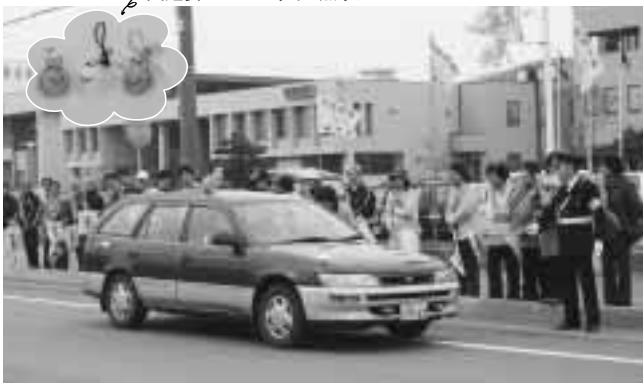
交通安全マスコット・無事カエル

を丁寧巻き付け、目や口を付けて仕上げ、カエルのマスコットには「無事帰る」の意味が込められています。 本町は、交通死亡事故ゼロの日「1526日」(4月10日現在)を継続し、日高管内の記録を更新中ですが、冬から春になり、ドライバーも気が緩みやすく、交通事故の危険度が増してこの時期、交通死亡事故ゼロの日「2000日」を次の目標として、一層の交通安全運動を町民一丸となつて取り組んでまいります。