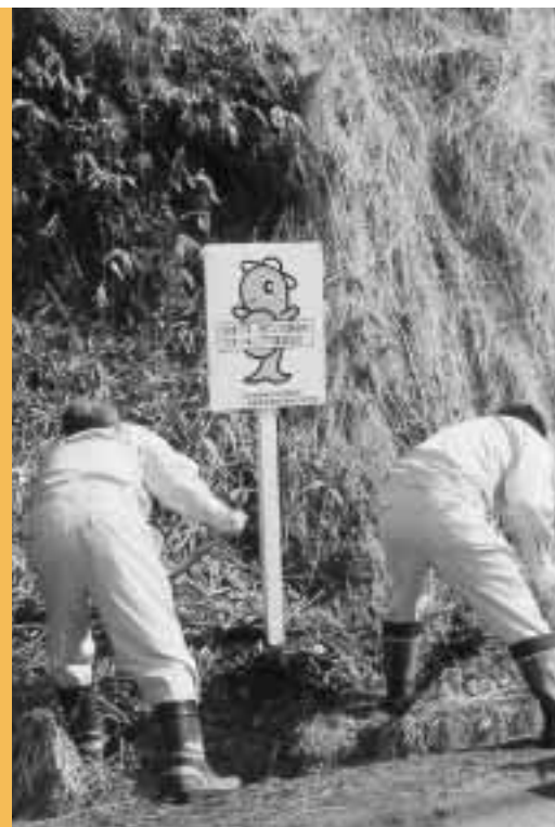
松川橋付近に“のんちゃん”看板を設置しました ごみがあったら勇気をもって拾いましょうネ