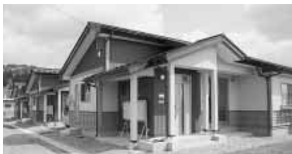
あたらしい村営新山住宅が全9棟に

村道 城内二又線と館公園線の改良をすすめる、安全・安心な道路整備につとめます。また、明内川の旭町地区のため用地買収をすすめます。