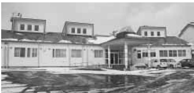
3月に完成した高齢者グループホームことぶき

延長保育や地域子育て支援センター事業、村単独による障害児保育、乳児保育の特別保育を積極的におすすめ、昨年度より実施している 乳児の保育料無料化 など、3歳未満児の保育料の大幅な軽減をひきつづきおこないます。 放課後児童の育成 城内、新山、玉川地区に 児童クラブ をこれまでどおり設置し、児童の健全育成の向上をはかります。