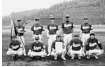
8地区対抗野球で玉川が初優勝(6/24)

【問い合わせ先】放送大学岩手学習センター(岩手大学構内) 019-653-7414