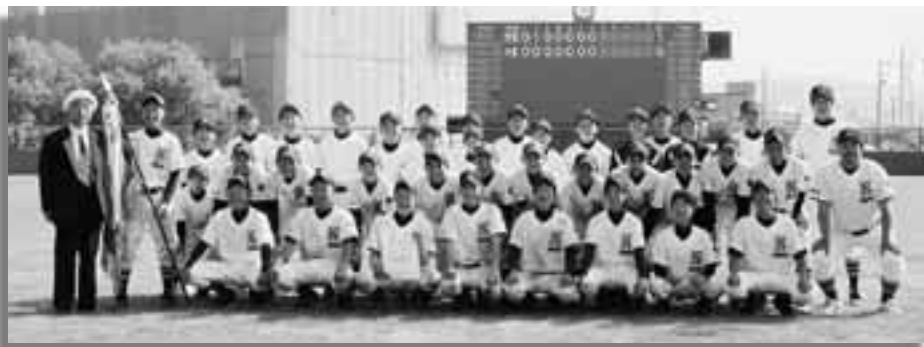
10年ぶり5回目の優勝を飾った野田中野球部