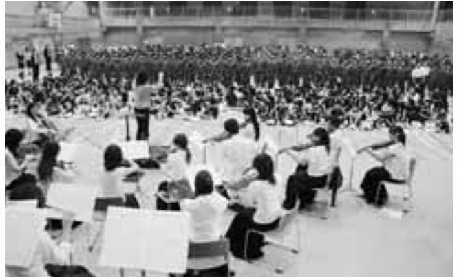
楽団の演奏に合わせて合唱する野田中生

客席と演奏者の距離が近い体育館のフロアで、プロの演奏を聴けるという貴重な体験ができ、本物の音の素晴らしさが身近に感じられました。