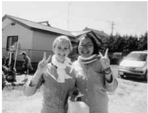
楽しかった「野田観光まつり」。初めておみこしを担ぎました

子ども達に英語を教えるのも初めてでしたが、とても楽しかったです。子ども達はみんなとても元気で、英語の勉強をがんばりました。野田で暮らせたことは、本当に幸せでした。この1年間をずっと忘れないでいたい。野田のすべての皆さんに「ありがとうございます」