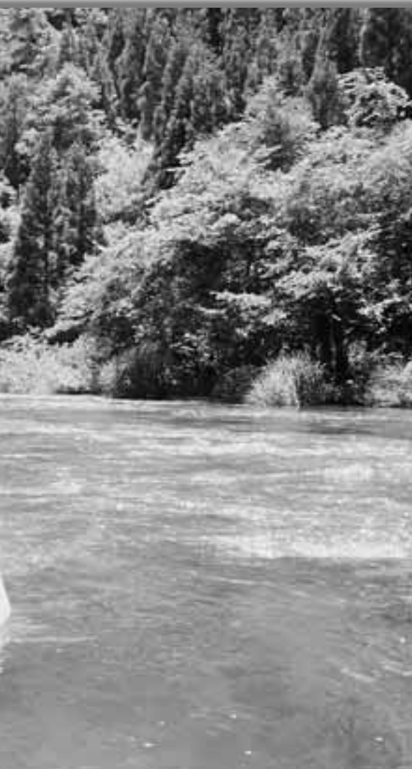
の川辺はとても気持ちがいいです

岩泉町を水源、野田村を河口部とし、自然そのままの姿を残す全長27・9キロメートルの原始の川「安家川」。この川の流域住民らが自然観察や保護活動など、森や川を守り育てることを目的とした「森と海をつなぐ環境保全事業」は7日、夏の強い日差しが降り注ぐ岩泉町内の安家川流域で行われました。