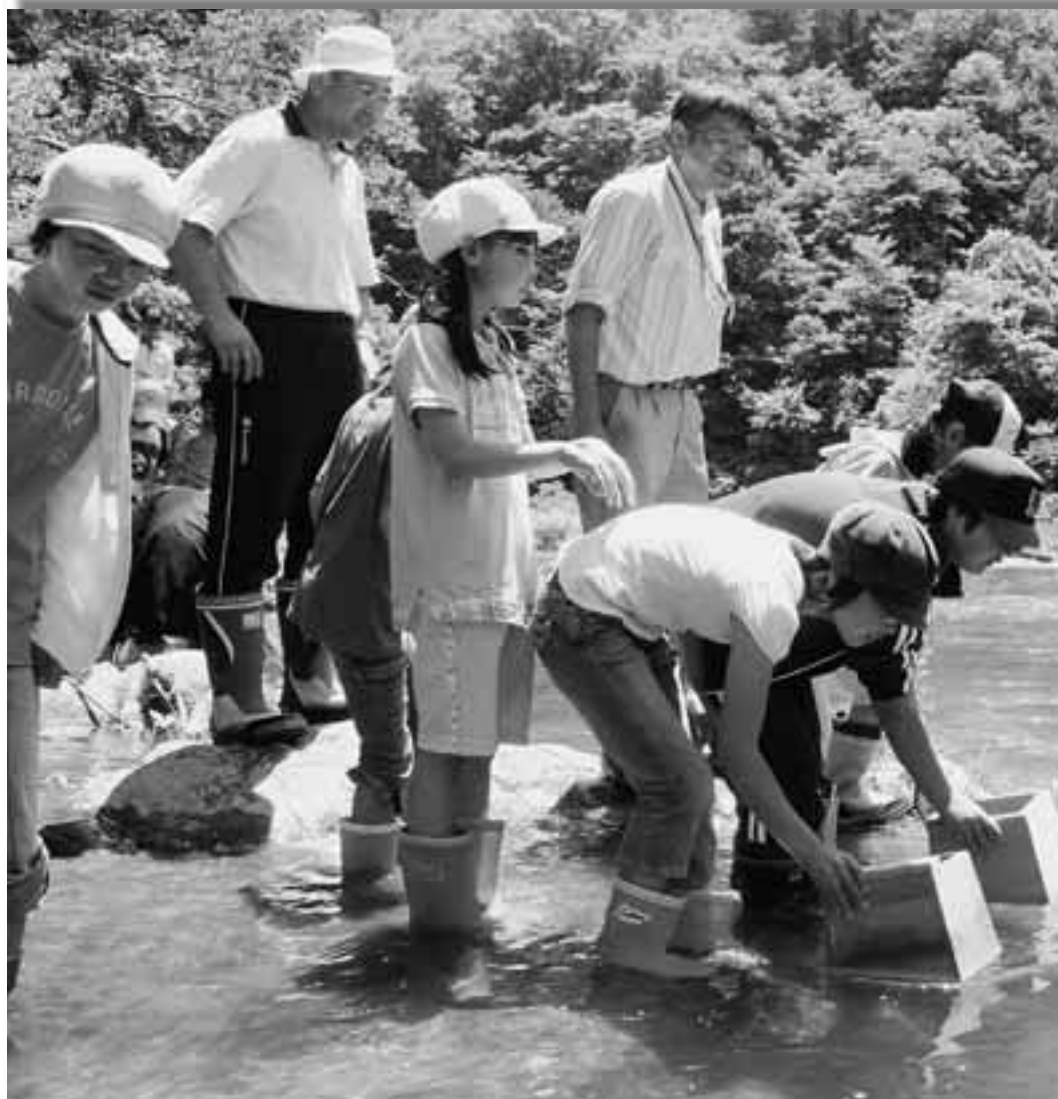
箱眼鏡を使い水中の小魚などを観察する子どもたち。夏の強い日差しの中、安家川