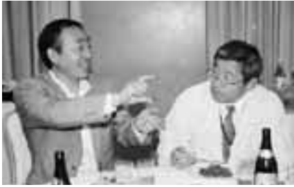
久しぶりの再会に話しも弾みます