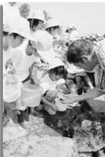
磯に住む生物を観察する児童たち

は「また捕まえた」「大きなカニさんが逃げた」などと歓声を上げながら楽しんでいました。