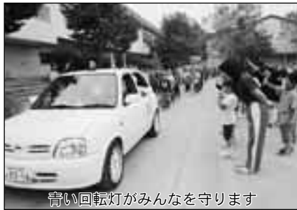
青い回転灯がみんなを守ります