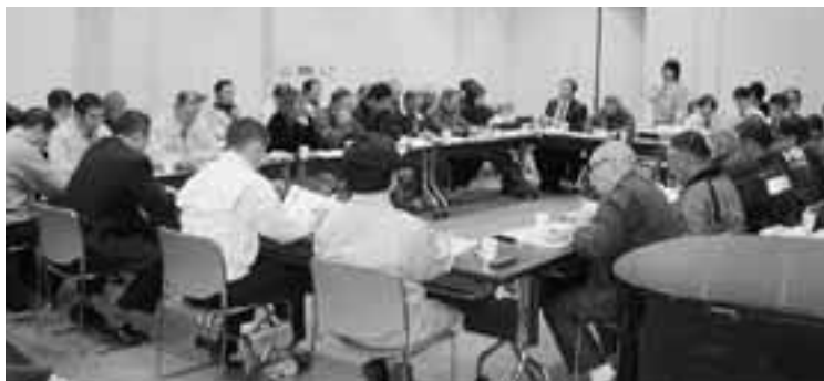
生産者など、多数が参加した「村の農業を考える会」

「村の農業を考える会」をきっかけとして、担い手の育成や集落営農に向けての取り組みを支援し、また自給農家や農