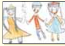
かたやのんちゃん(北区・5歳)