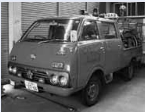
入札物件の消防自動車