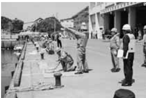
救命発射器操法訓練の様子

当日は「ゴムボート操法」「救命発射器操法」「火災船救助訓練」や「海上保安部ヘリコプターによる遭難者吊り上げ救助訓練」など、実際の有事を想定した中身の濃い訓練が行われました。 今回の訓練は技能の向上を図る上で、大変実りのあるものとなり、参加した各救難所員はいざという時に備え、海難救助に万全を期する意識を再確認し、無事大会を終えました。 されました。