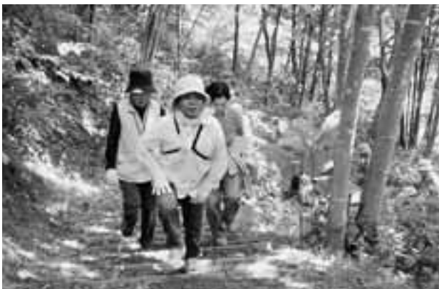
新緑の中、山頂を目指す参加者

天候に恵まれ、新緑と野鳥のさえずりの中、90分かけて九戸村側から山頂まで、つづら折りの石段を汗を流して登りました。帰り道は、五つの滝を眺めたり、山野草の観察をしたりしながら、自然を満喫した1日でした。