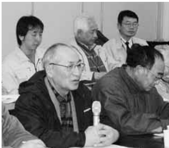
積極的に意見を述べる生産者たち

家以外の土地を持った人たちを交えた話し合いを行い、結いの精神を生かした村ぐるみの農業への展開を目指します。 皆さんで、明日の農業について話し合い、村の農業を守り育てましょう。