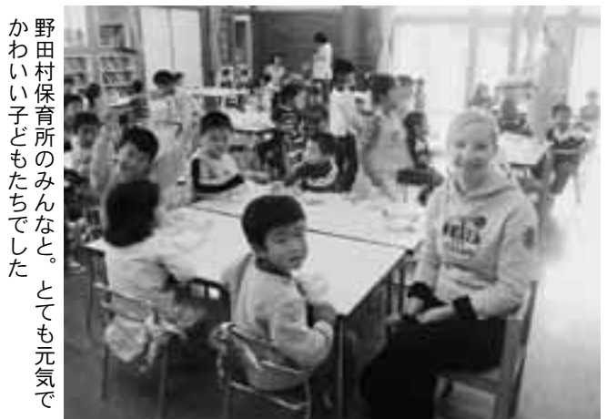
野田村保育所のみんなと。とても元気でかわいい子どもたちでした