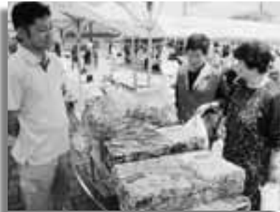
村青年会による資源リサイクルのPR

会場内では、縄ないや竹とんぼ、お手玉などの手作り伝承コーナーやくしもちやおでんなどの模擬店、村青年会ではペットボトルな