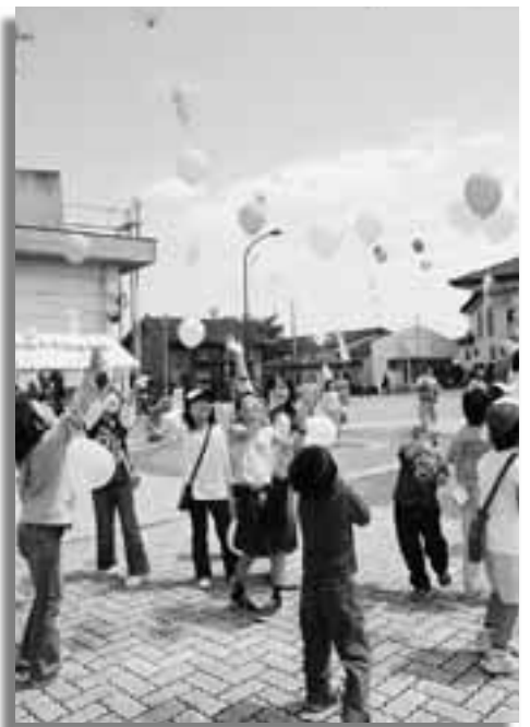
メッセージに願いを込め、地球に優しい風船に付けて飛ばしました

会場内では、縄ないや竹とんぼ、お手玉などの手作り伝承コーナーやくしもちやおでんなどの模擬店、村青年会ではペットボトルな