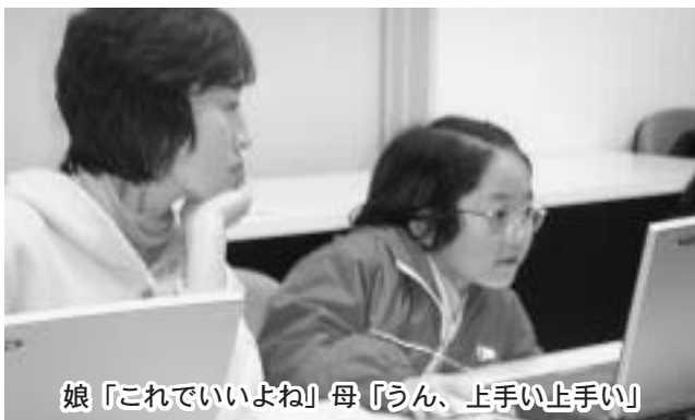
娘「これでいいよね」母「うん、上手い上手い」