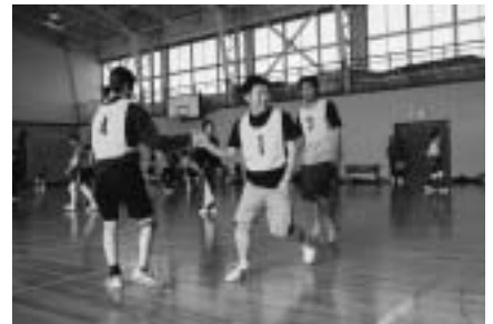
最大の武器はチームワーク!?