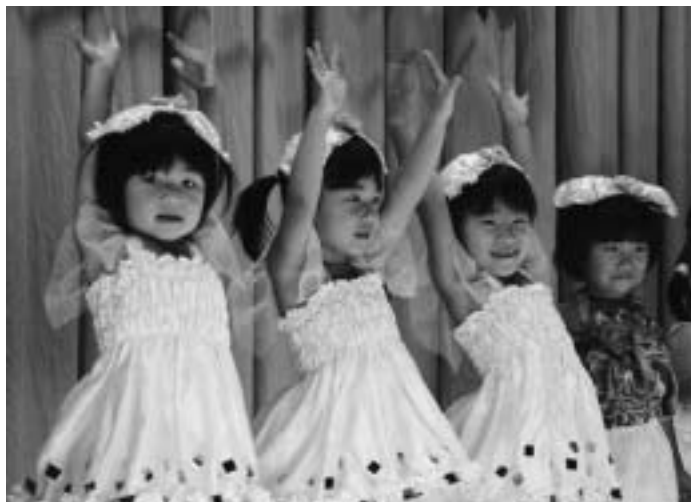
かわいらしい衣装を着て決めのポーズ!

発表は0歳児~1歳児による自己紹介で幕を明け、一人ひとり名前が呼ばれると、大きな声で返事をしていました。また、園児たちは元気に歌を歌った