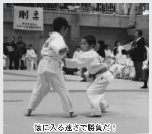
懐に入る速さで勝負だ!

たい!」と、練習の成果が発揮できたことに感激していました。大会に出場した貴重な経験は、小さな柔たちに大きな勇気と自信を与えたようでした。