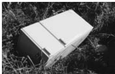
サンヨー85年製水色の冷蔵庫