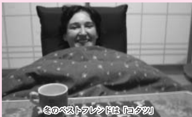
冬のベストフレンドは「コタツ」

寒いですね!野田で2度目の冬を迎えて、私の相棒「コタツ」も毎日フル稼働しています。ニュージーランドにはコタツがないので、持って帰ろうと思っています。ニュージーランドで流行らせて、「コタツビジネス」でもやってみようかな!?