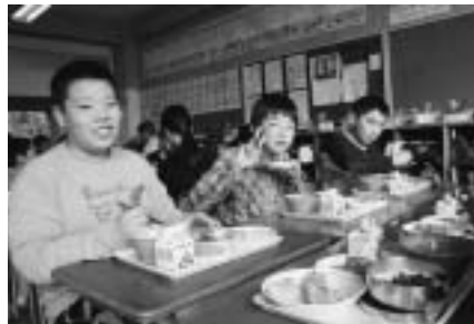
11月11日鮭の日給食会

掲載を遠慮される方は、届け出のときに戸籍係に話してください。 届け出の期間は、出生届が生まれた日を含めて14日以内、死亡届は7日以内です。