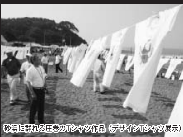
砂浜に群れる圧巻のTシャツ作品 (デザインTシャツ展示)