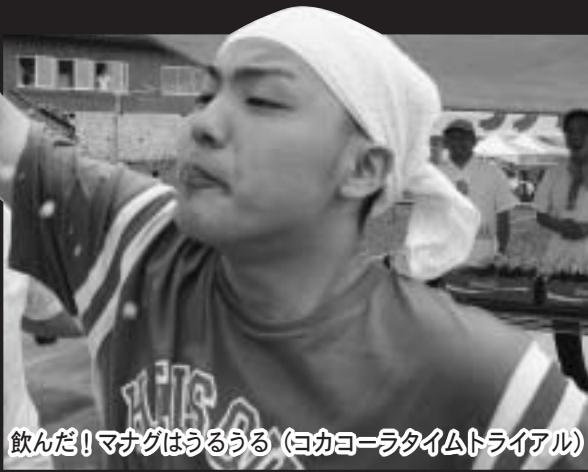
飲んだ! マナグはうるうる (ヨカコーラタイムトライアル)