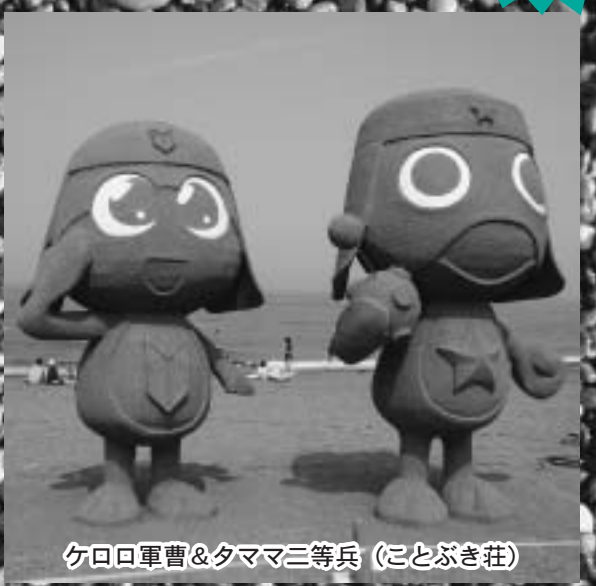
ケロ口軍曹&タママ三等兵 (ことぶき荘)