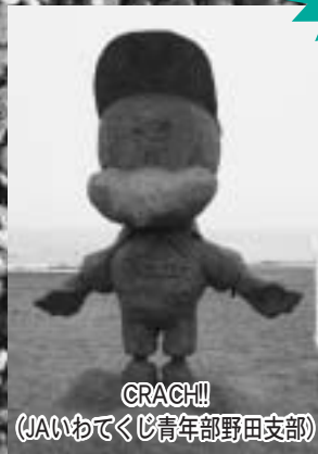
GRACH!!! (JAIいわてくじ青年部野田支部)