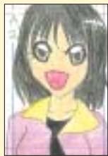
打座和音さん(北区・8歳)