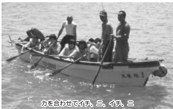
力を合わせてイキ、ニ、イキ、ニ

集まれ！野田っ子の16人が7月28日（木）、久慈地区少年海づくり大会」に参加し、焼きウニづくりやボートこぎ、ウニとヒラメの稚魚放流を体験しました。開会式では久慈地域の水産物をPRする「タベルンジャー」も登場し、児童らは海の食材について楽しく学びました。