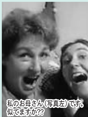
私のお母さん(写真左)です。似てますか??

暑いですね。ニュージーランドは暑くてもからっとしているので、湿度の高い日本の夏にまだ慣れていません。でも、川や海で泳ぐことができるので楽しいです。