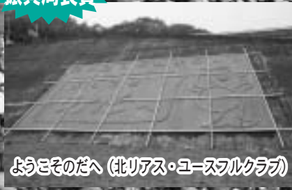
ようこそのだへ (北リアス・ユースフルクラブ)