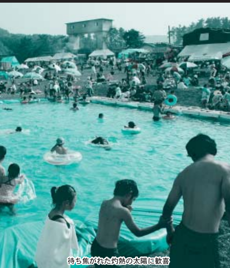
待ち焦がれた灼熱の太陽に歓喜