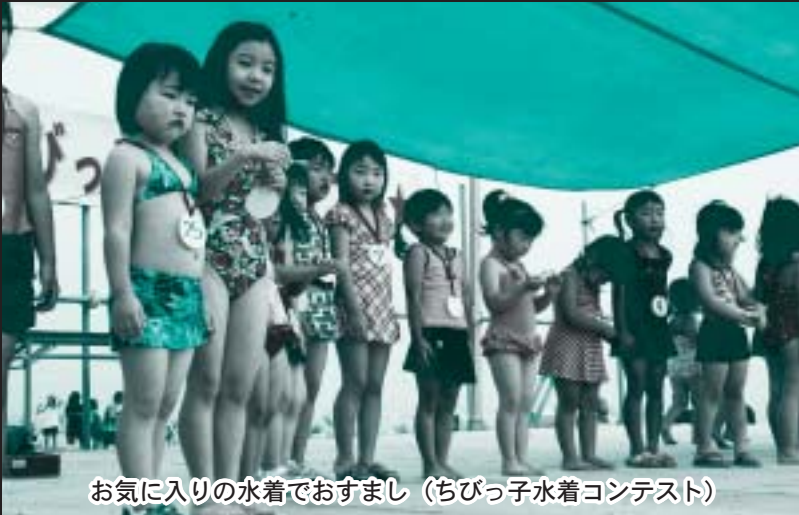
お気に入りの水着でおすまし (ちびっ子水着コンテスト)