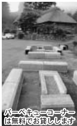
バーベキューコーナー は無料でお貸しします