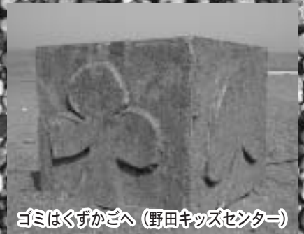
ゴミはくずかごへ (野田キッズセンター)