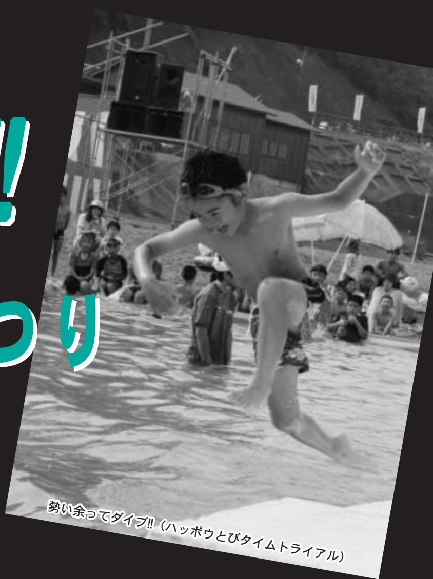
勢い余ってダイブ!! (ハッポウとびタイムトライアル)

「のだ砂まつり」が7月30日（土）、31日（日）の2日間、十府ヶ浦海岸で開催されました。会場には短い夏の楽しいイベントを満喫しようと、多くの家族連れや若者などでにぎわいました。