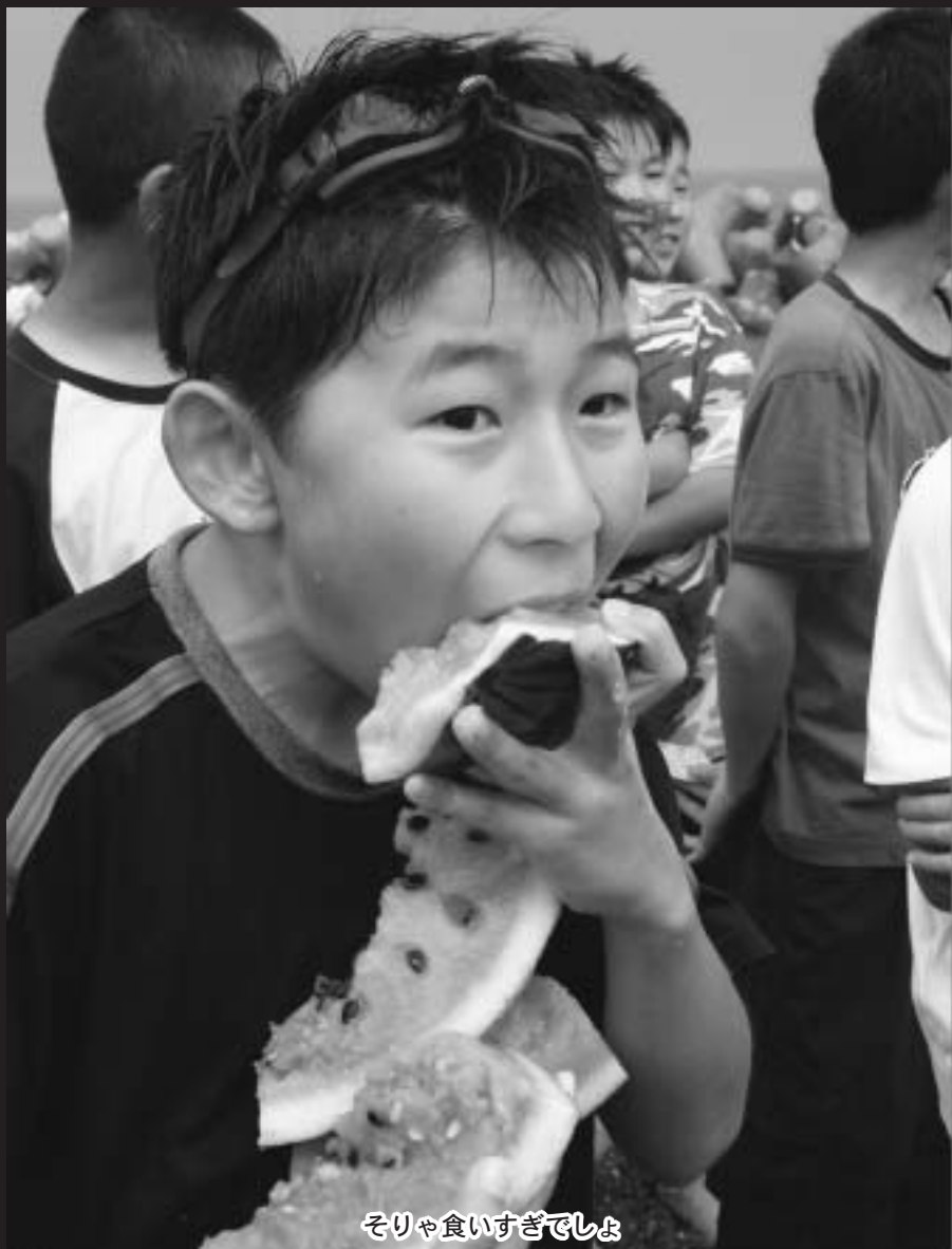
そりゃ食いすぎでしょ