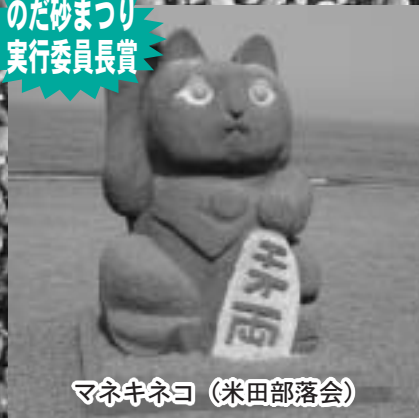
マネキネコ (米田部落会)