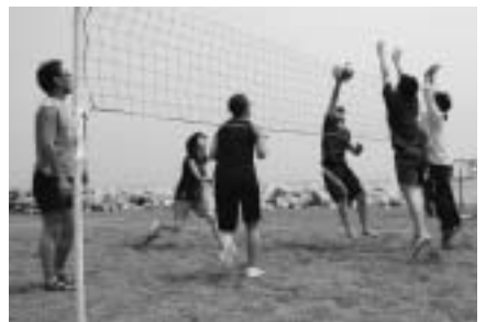
熱戦! ビーチソフトバレー