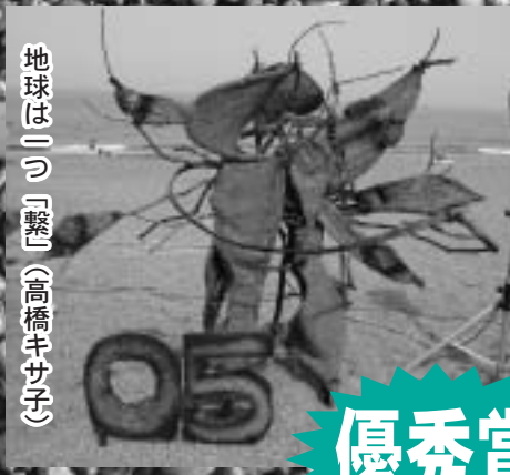
地球はニッ「整」 (高橋キサ子)