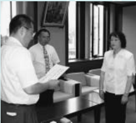
大役よろしくお願ひします