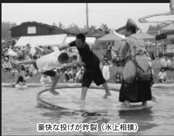
豪快な投げが炸裂 (水上相撲)