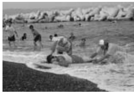
野田塩ベコの道がapbank融資事業も実施