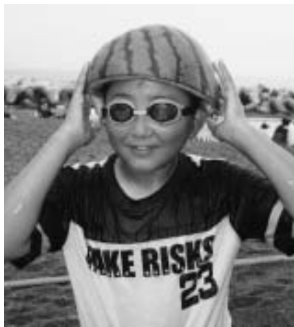
食べた後はリサイクル?!