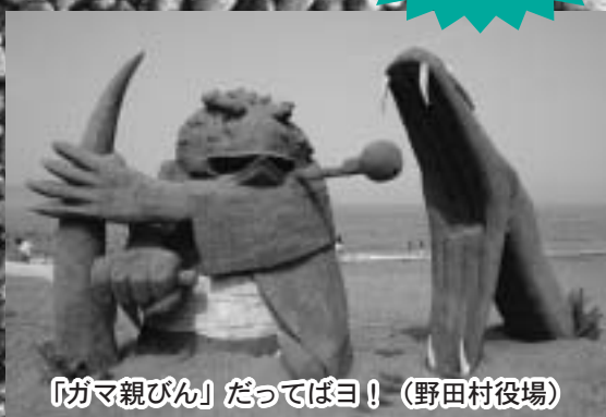
「ガマ親びん」 だってばヨ! (野田村役場)