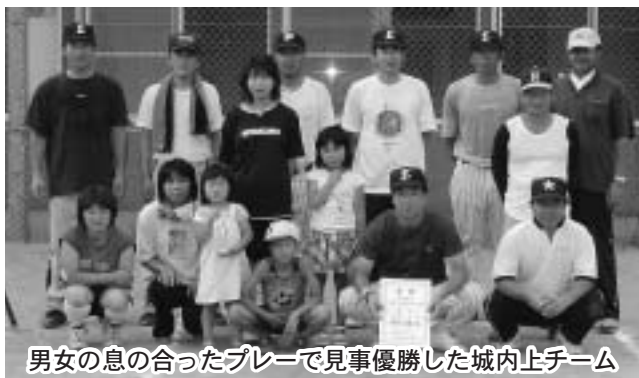
男女の息の合ったプレーで見事優勝した城内上チーム

7日(日)、山村広場で第19回壮年ソフトボール大会が開かれ、各地区から計10チームが参加しました。