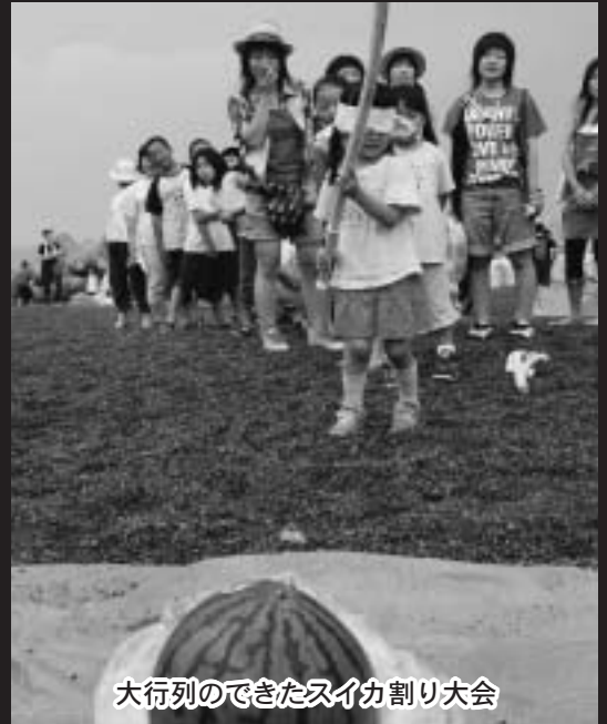
大行列のできたスイカ割り大会