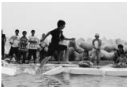
水上を滑るように走るのがコツ