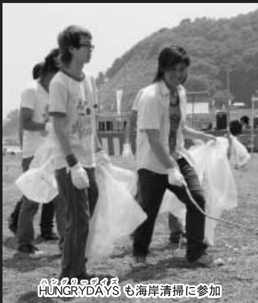
ハンガリーロブライズ HUNGRYDAYS も海岸清掃に参加