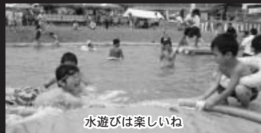
水遊びは楽しいね