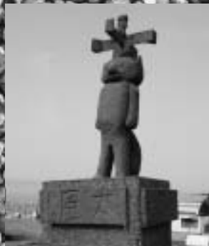
レッサーパンダ風太君 (野田村商工会青年部)