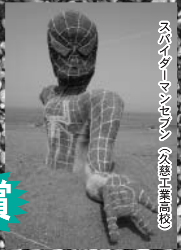
スパイダーマンセブン (久慈工業高校)