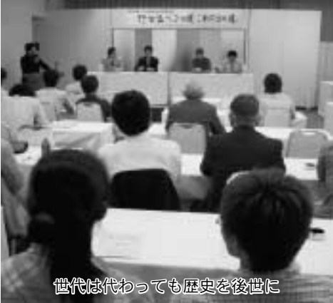
世代は代わっても歴史を後世に

NPO法人の認証は久慈管内で、久慈市のやませデザイン会議に次いで二番目となります。