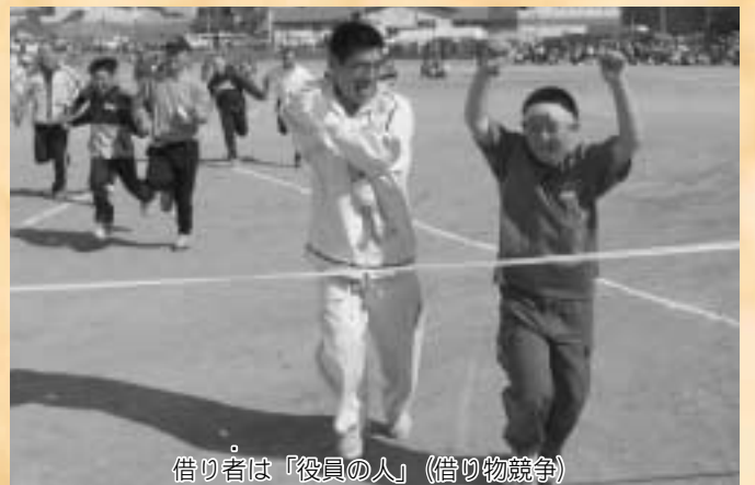
借り者は「役員の人」（借り物競争）