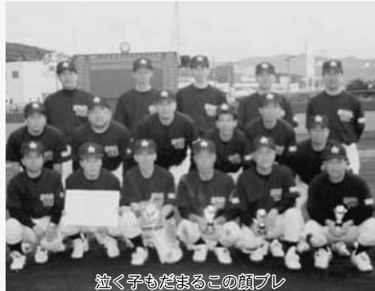
泣く子もだまるこの顔ブレ

村野球協会OBチームが、県野球協会主催の県OB軟式野球大会で、準優勝に輝きました。