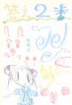
◎めっき肌寒くなったね