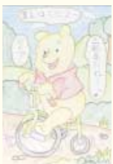
◎ミラクルな前輪ですね