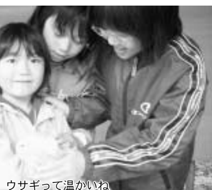
ウサギって温かいね

げ大会など、楽しい体験型のイベントが催され、豆腐田楽や手打ちそばなどの郷土料理とともに人気を集めていました。「やったー。大きいヤツを捕まえた」全身びしょぬれになりながら捕らえたイワナを、ぎゅっと袋に押し込み目を輝かせる子どもたち。大人気のイワナのつかみ取り大会に、天気は無関係のようでした。おいしい食べ物と澄んだ空気で、お腹と心を満たした人たちは、満足そうな表情で秋のひとときを過ごしていました。