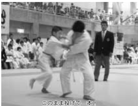
このまま投げて一本！