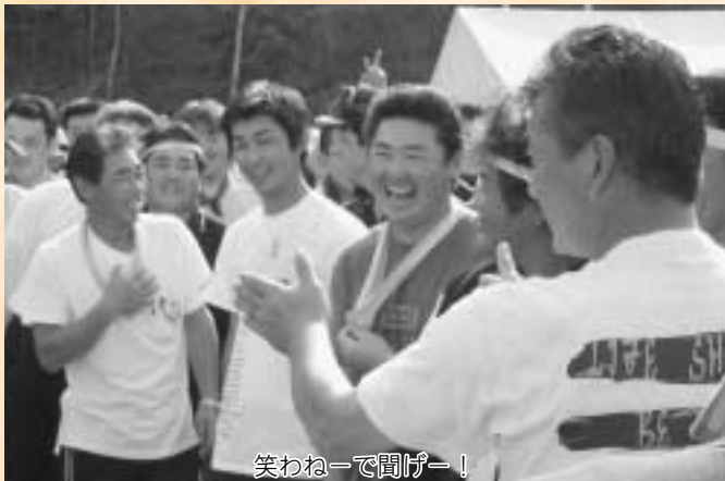
笑わねーで聞げー！