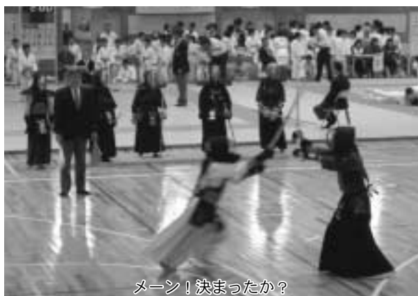
メイン！決まったか？