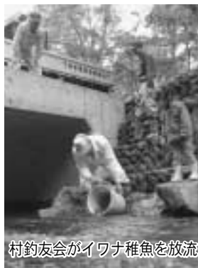
村釣友会がイワナ稚魚を放流