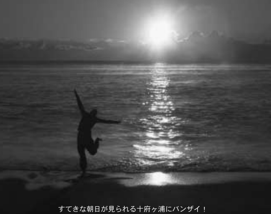
すてきな朝日が見られる十府ヶ浦にバンザイ！