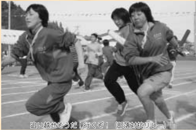
追い越せそうだ！行くぞ！（部落対抗リレー）