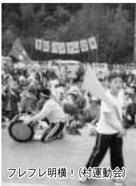
フレフレ明横！(村運動会)