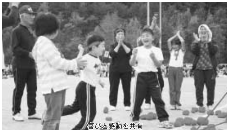
喜びと感動を共有

家庭の役割、学校の役割を考えることは、それをはっきり分けるというよりも、連携をさらに強めて、相乗効果を高めるために必要です。