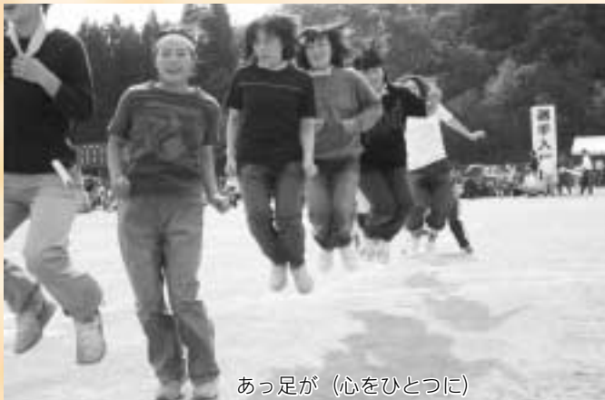
あっ足が（心をひとつに）