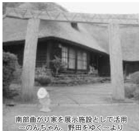
南部曲がり家を展示施設として活用 ～のんちゃん、野田をゆく～より

日形井地区にあるアジア民族造形館は、昭和六十一年、日本で初めてアジア民族の資料を展示する施設として、約二百年前に建てられた南部曲がり家を改築してオープンしました。