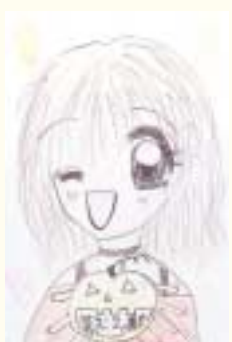
◎十月三十一日はハロウィンですね