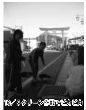
10/5クリーン作戦でピカピカ