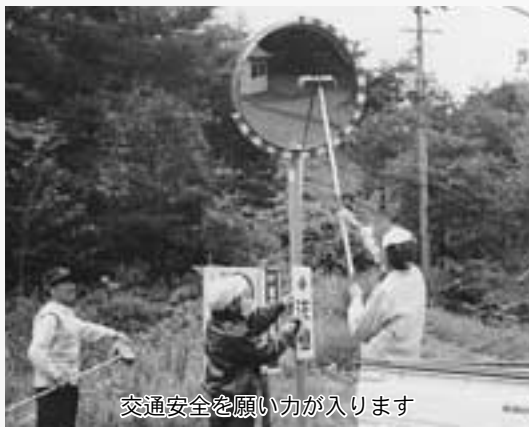
交通安全を願い力が入ります