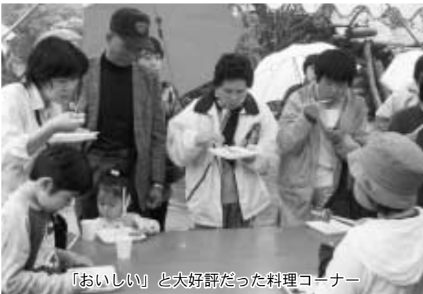
「おいしい」と大好評だった料理コーナー

宮古市や青森県八戸市から訪れた人も多く、「初めて来たのに懐かしく感じる。料理も音楽も大変満足だった」と野田の自然と遊牧民の文化を満喫していました。