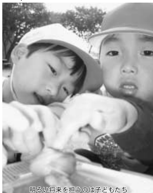
明るい将来を担うのは子どもたち

脳幹が痩せると「忍耐力」がなくなると言われています。今の子供たちは「耐性欠如」。耐性がなから、他人との摩擦という波に耐え切れず、波が打ち込んでくる内側にある船が破損される。いわゆる人間崩壊を招き、犯罪を起す引き金ともなりうるわけです。脳幹を丈夫にするには、「叱ったり」「おだてたり」「我慢させる」ことを繰り返すこと以外にないかもしれません。