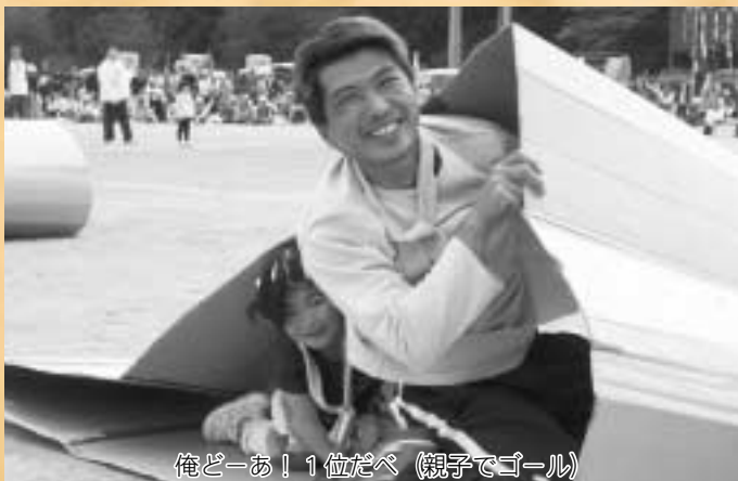
俺どーあ！1位だべ（親子でゴール）