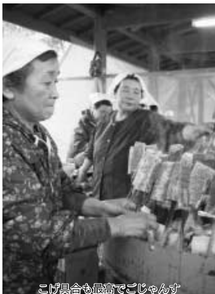
こげ具合も最高でござんす

げ大会など、楽しい体験型のイベントが催され、豆腐田楽や手打ちそばなどの郷土料理とともに人気を集めていました。「やったー。大きいヤツを捕まえた」全身びしょぬれになりながら捕らえたイワナを、ぎゅっと袋に押し込み目を輝かせる子どもたち。大人気のイワナのつかみ取り大会に、天気は無関係のようでした。おいしい食べ物と澄んだ空気で、お腹と心を満たした人たちは、満足そうな表情で秋のひとときを過ごしていました。