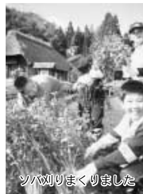
ソバ刈りまくりました