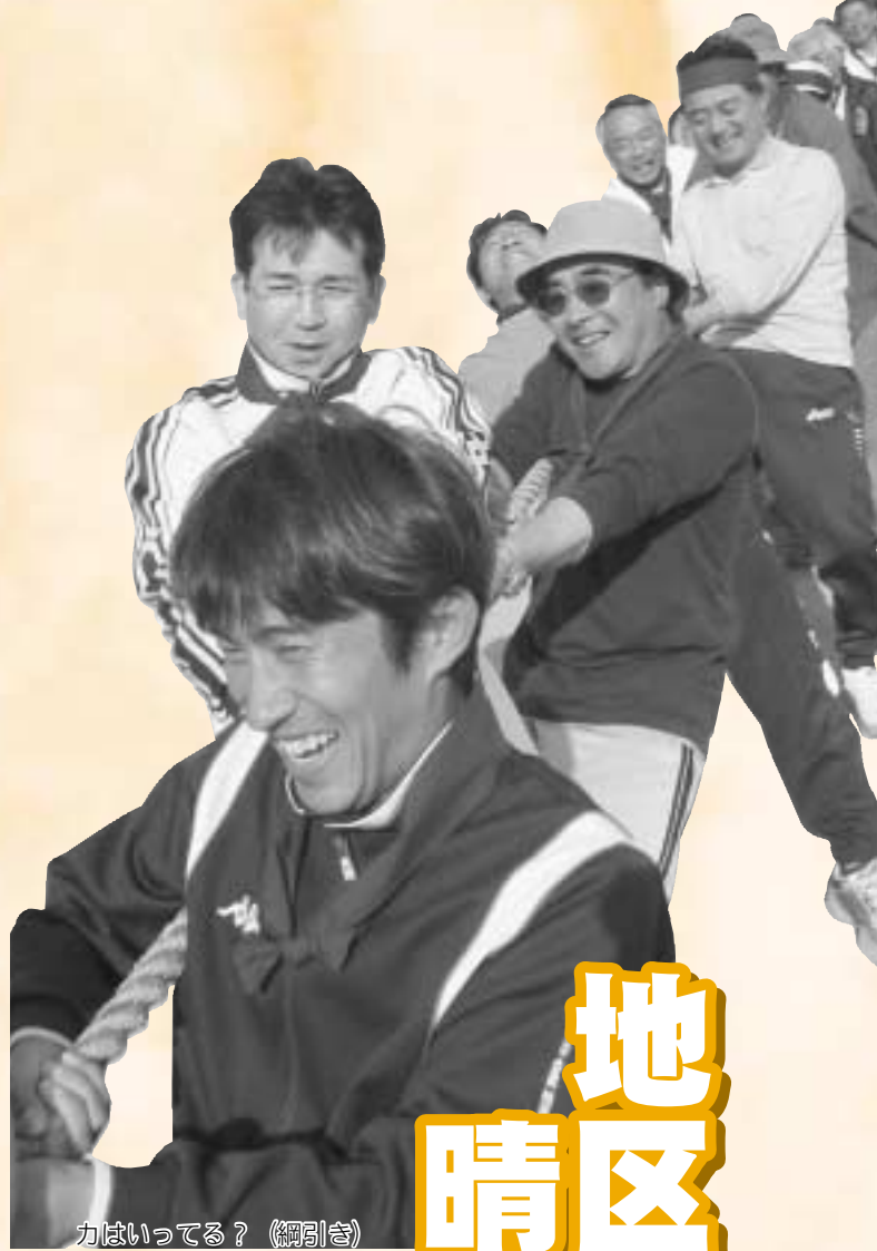
力はいつてる？（綱引き）