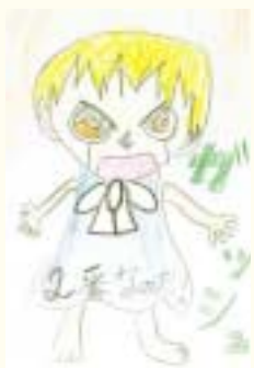
◎ごきも上手なのだ！