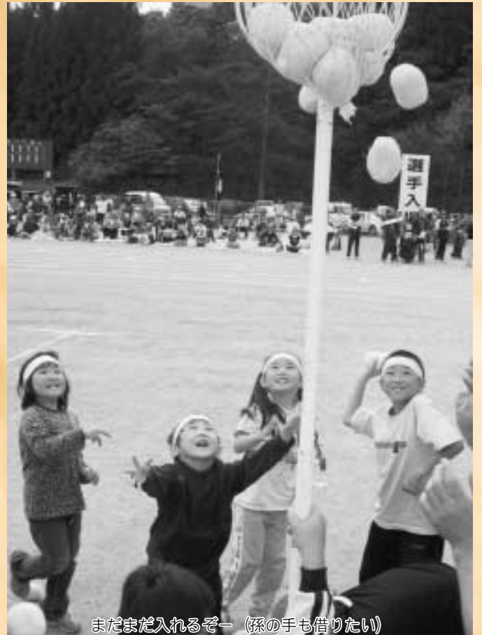
まだまだ入れるぞー（孫の手も借りたい）