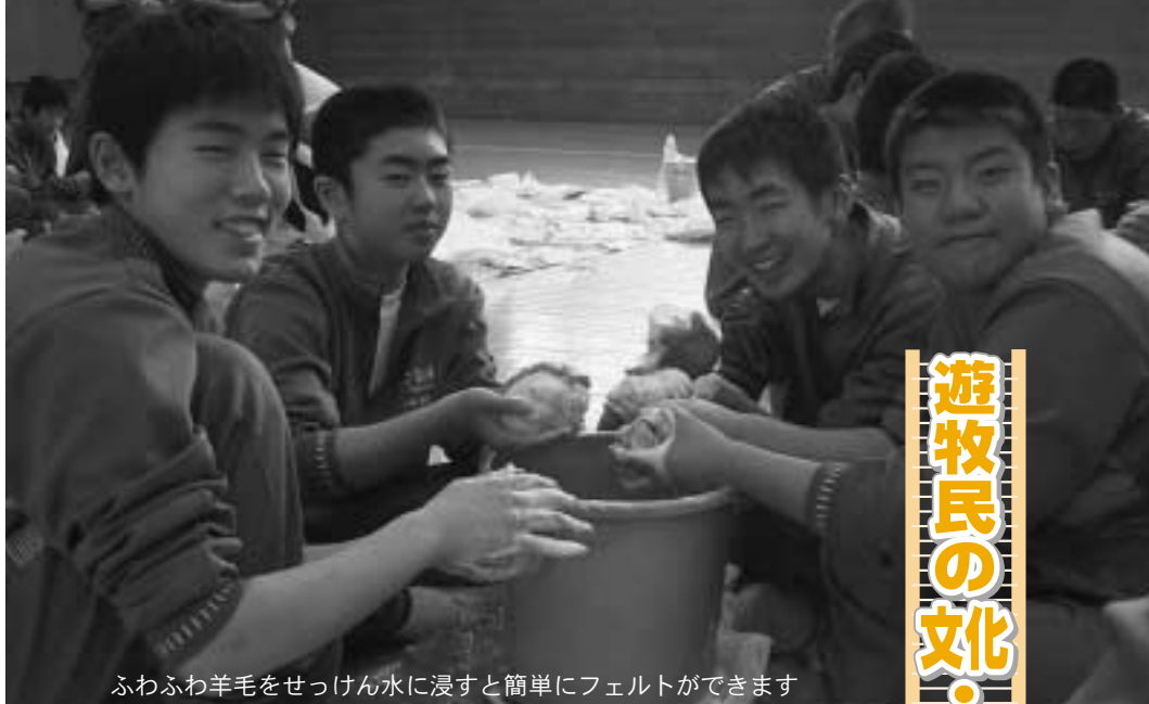
ふわふわ羊毛をせっけん水に浸すと簡単にフェルトができます