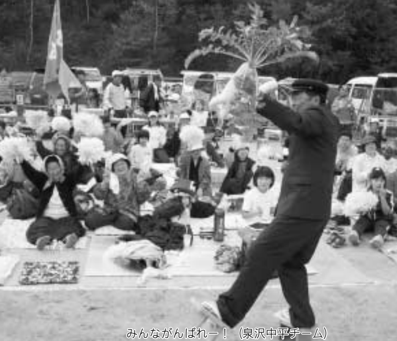
みんながんばれー！（泉沢中平チーム）