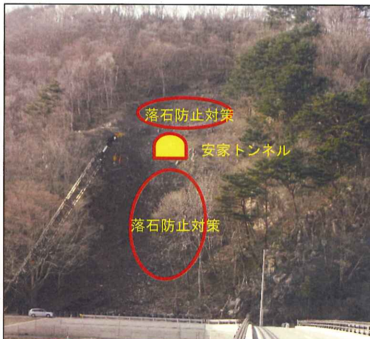
安家トンネル到達側坑口全景(新安家から久慈方向を望む)