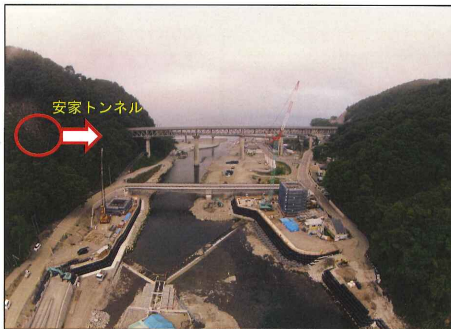
新安家大橋P1, P2橋脚全景(空からの写真)