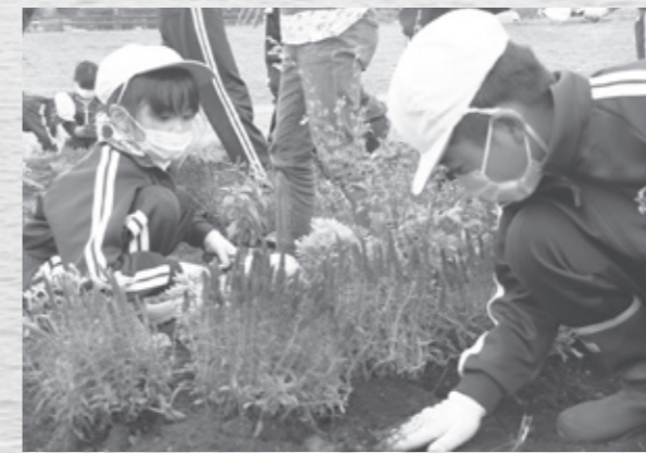
見る人たちを元気づける花壇ができたね！