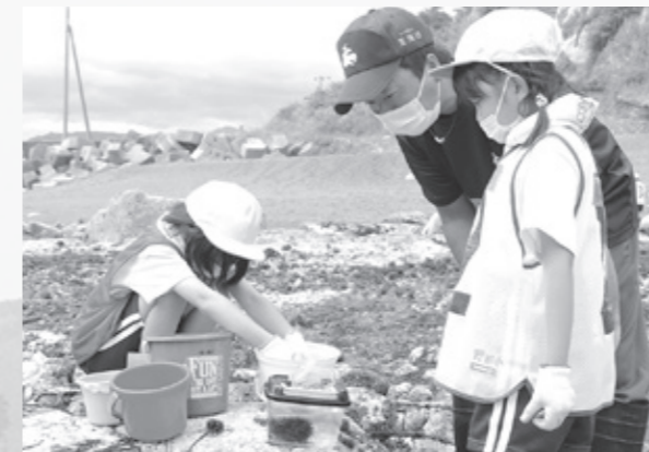
安心して下さい、海にもどしましたよ！