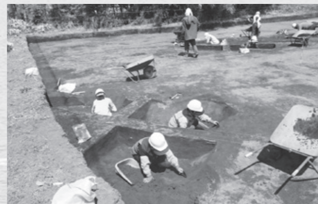
野田小学校建設予定地の調査風景