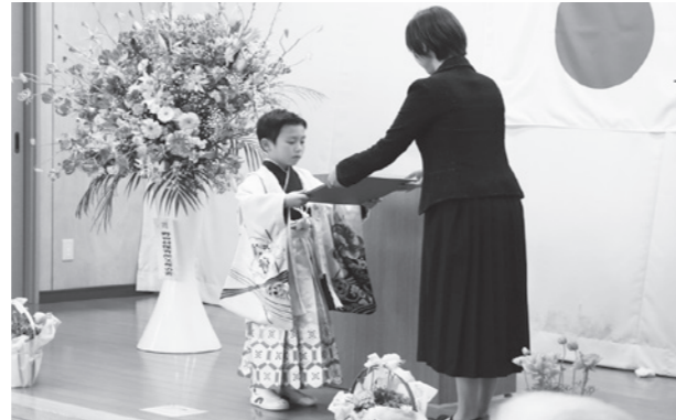
保育証書を受け取る園児