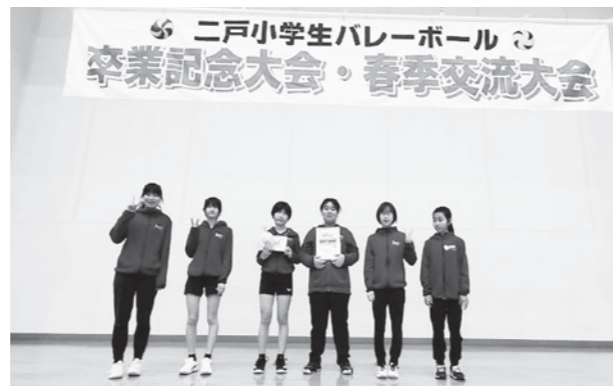
入賞おめでとうございます