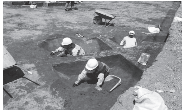
埋蔵文化財発掘調査の様子