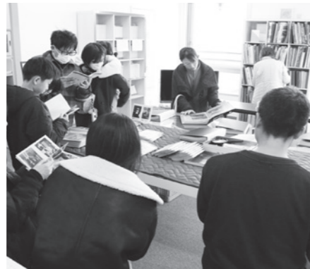
写真返却お茶会(3月8日)