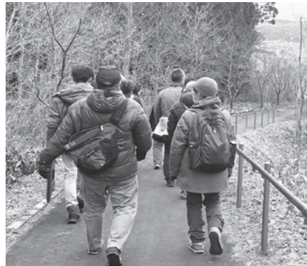
野田村未来さんぽ(3月11日)