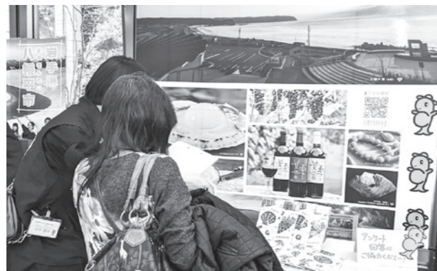
野田村ブースの様子

岩手との「つながり」や「関わり」のきっかけ作りを目的としたこのイベント。野田村ブースには「心はいつものだ村民」の登録者をはじめ、村ゆかりの人々が数多く来場しました。来場者は「懐かしい気持ちになった。また岩手に行きたくなった」と話しました。