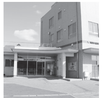
ご相談は保健センターで 受け付けています