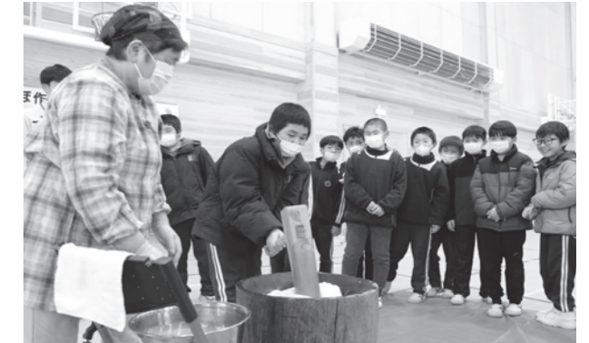
力を合わせて「ヨイショ！」

参加した5年生の児童が順番に杵を振ると、周囲からも「ヨイショ！」と元気な掛け声が飛び交い、クラス全員で餅つきを楽しみました。児童の1人は「お米がお餅に変わっていくのがすごかった。ここまで来るのに色々な作業が必要だと分かった。食べるのが楽しみ」と笑顔で話しました。