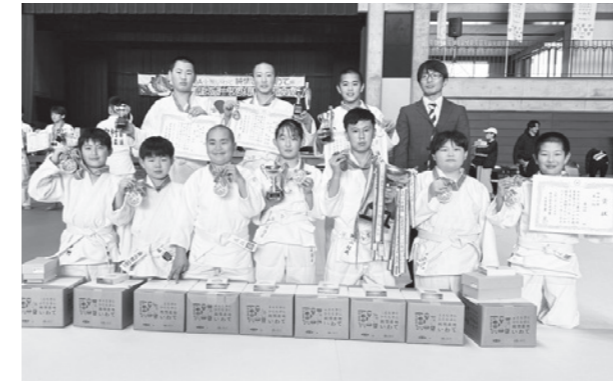
直心館のメンバー