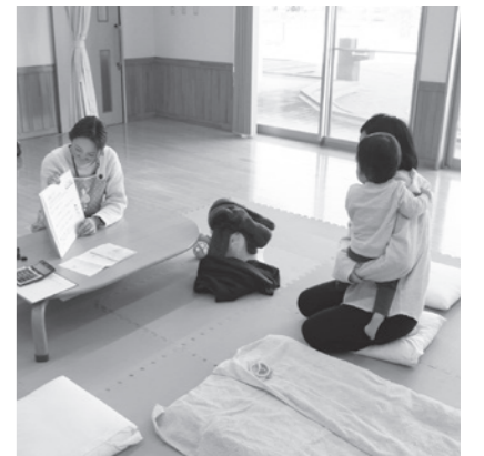
離乳食教室や親子教室も 行っています