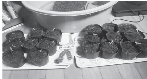
自宅の居間で育つトマトの苗