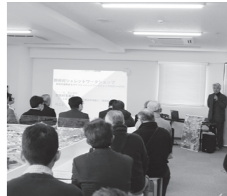
野田村3.11ミーティング(3月11日)