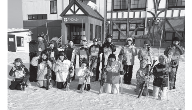
参加者みんな上達しました！

参加した子どもたちは「難しかったけど、滑れるようになってうれしい」と満足気な様子でした。