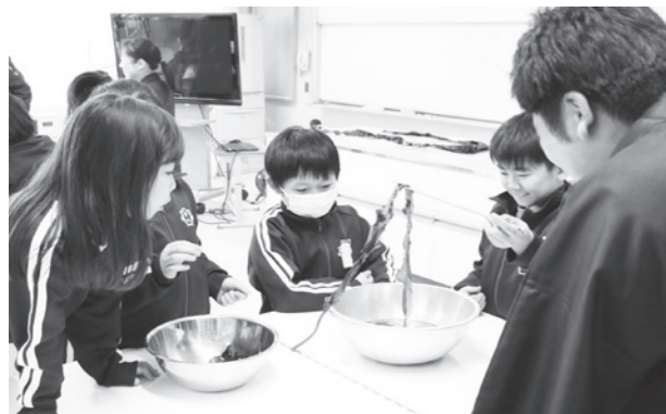
熱湯に入れるとどんな色になるのかな?

児童は「ワカメはどうやって栄養を吸収するのですか」などの質問をして地元の海産物への理解を深めました。