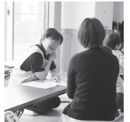
1歳6カ月・3歳児健診の様子