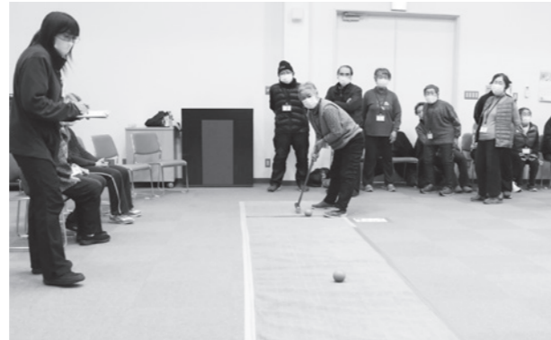
スカットボールに挑む参加者

当日は29人が参加し、8チームに分かれて「玉入れ」「輪投げ」「スカットボール」の3種目に挑みました。参加者は、狙い通りに玉が入ると歓声を上げたり、惜しいショットに励まし合ったりと、チームの垣根を越えて交流を楽しみました。