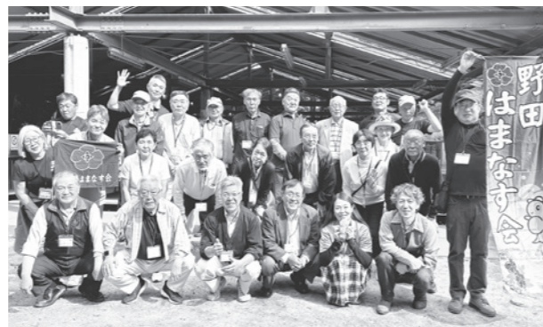
昨年10月に行われた日帰りレクリエーション