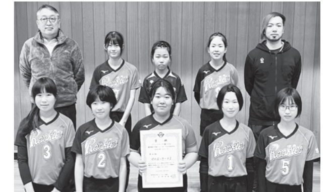
けんぼっきーず2のメンバー