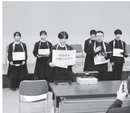
被災地オンライン交流会(3月1日)

東日本大震災から15年。あの日を忘れず、震災の教訓を次世代へとつなぐため、村内で追悼や交流などのさまざまな行事が行われました。