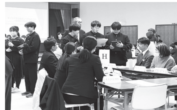
体験した内容を発表する生徒

生徒たちは、社会体験や合同職業講演会を通して学んだことを発表したほか、グループで意見交換を行いました。発表や意見交換を通して、自らの将来やキャリアを考える時間となりました。