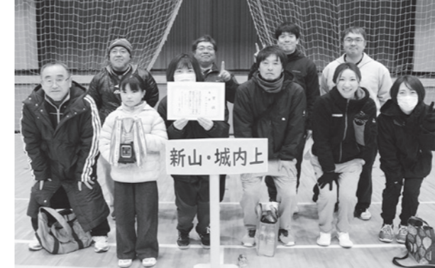
優勝した新山・城内上チームのメンバー