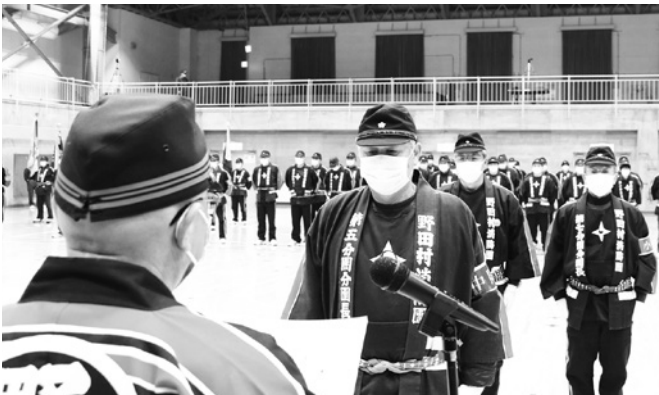
最優秀賞の第5分団

要である消防団の皆さまには、災害から村民の生命を守るという崇高な精神のもと、より一層の研鑽と協力をお願いする」と訓示し、観閲、団員の姿勢や服装の点検を行いました。 式典終了後には、城内地区でラッパ隊の演奏に合わせて威風堂々の分列行進を披露。その後、愛宕参道広場で、火災のない平穏な年となるよう、1年間の無火災を祈願しました。