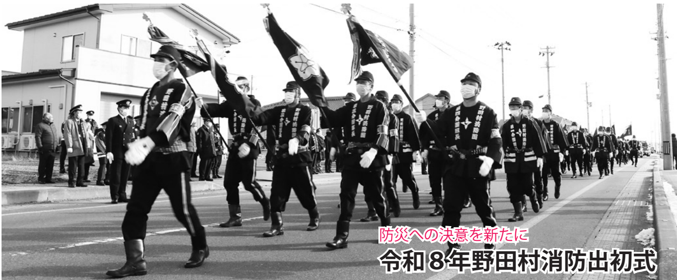
防災への決意を新たに 令和8年野田村消防出初式