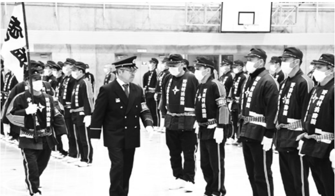
人員姿勢服装点検

機械器具点検表彰とは、車両や消防機械器具などに異常がないか点検し、その管理が顕著な分団を表彰するものです。