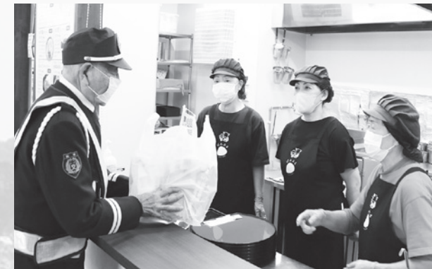
交通ルールを守りましょう

この日は、村内事業者や飲食店を訪問し、忘年会や新年会などで飲酒の機会が増える季節柄、飲酒運転の根絶と冬の道路環境に合わせた交通マナーの遵守を呼びかけました。