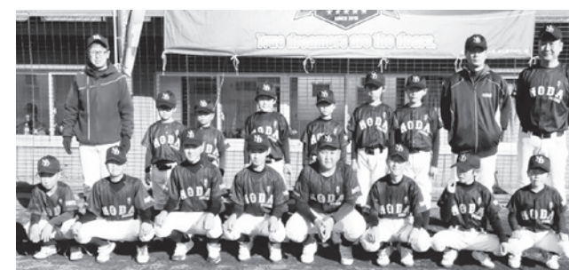
野田フェニックスのメンバー