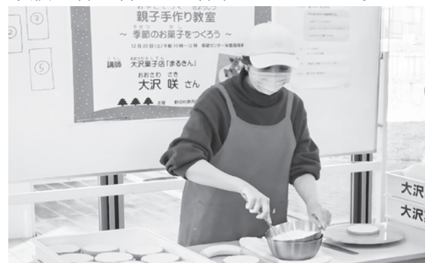
講師によるナッペの実演

パレットナイフと回転台を使ってスポンジに生クリームを塗るナッペに苦労する場面もありましたが、最後にはおいしいようなケーキが完成しました。自分たちで作った特別なケーキを手に、参加者は大喜び。家族の絆を深める時間となりました。