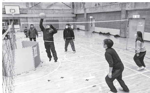
熱い試合を繰り広げる選手たち

思いがけない珍プレー・好プレーの連続に歓声が上がり、スポーツによる世代間交流を楽しんでいました。