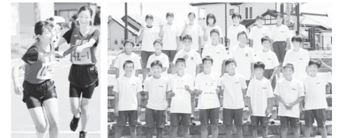
気持ちもつなぐ 野田中チームメンバー