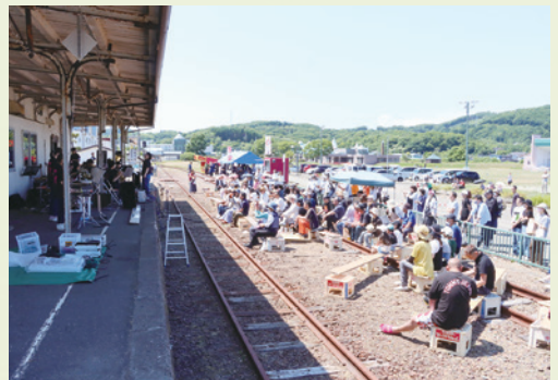
様似駅ライブの様子

また、ステージ演奏では様似町立様似中学校の吹奏楽部や町内バンドグループなどによる演奏が行われ、ライブ会場は終始賑わいを見せていました。