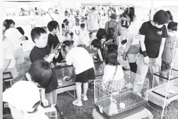
かわいい動物がいっぱい

移動式動物園や県内外のキッチンカーなどが出店され、会場は大盛り上がり。キッチンカーに並ぶ大人たち、移動式動物園でウサギやカメ、ハリネズミなどと触れ合う子どもたち。夏のひとときを満喫しました。