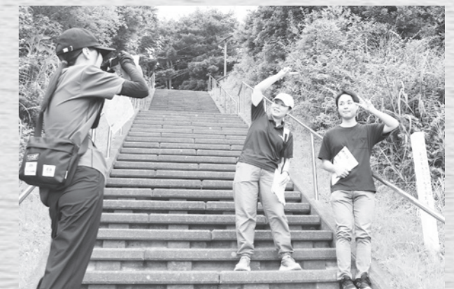
お台場公園へ上る階段です！

地図上にあらかじめ設定されたチェックポイントを制限時間内に巡り、見本と同じ写真を撮影して得点を獲得していく参加者たち。自分の足で村内を歩いて走って、村の魅力を感じながら優勝を目指しました。