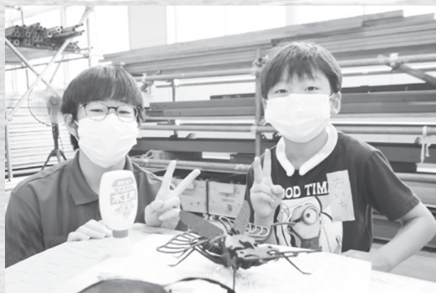
木工で作ったクワガタ…躍動感がある…！

電子機械科ではオリジナル時計作り、建設環境科では木工で生物を作りました。お兄さん、お姉さんから優しく指導を受けて完成を目指す児童たち。参加した児童からは「難しいけど、楽しかった」との感想があり、物作りの奥深さを体験しました。