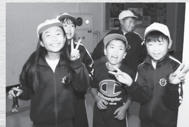
夜の校舎は怖いけど、ちょっとわくわくするよね

14日の夜には、同校の校庭でキャンプファイヤーや趣向を凝らしたレクリエーションを実施。校舎内での肝試しでは、普段は入れない夜の校舎にドキドキの児童たち。先生が扮するお化けを見て、悲鳴と笑い声が校舎内に響き渡りました。