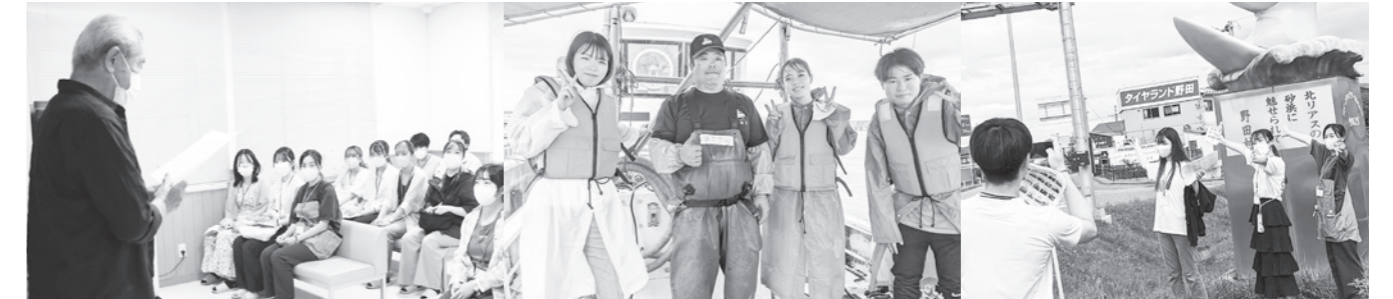
野田村をまるごと体感!まさに多職種の視点です!

地域医療や福祉の現場で大切な「多職種連携」という視点を学ぶため、岩手医科大学の各学部(医学、歯学、薬学、看護)と岩手県立大学社会福祉学部の学生が、村内の医療や福祉関連施設などを見学するとともに、学生同士が連携して課題にも取り組みました。